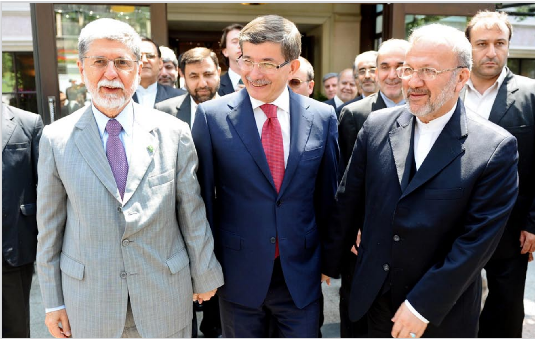
اجتماع انقرا بشأن الملف النووي الإيراني ... أ.ف.ب