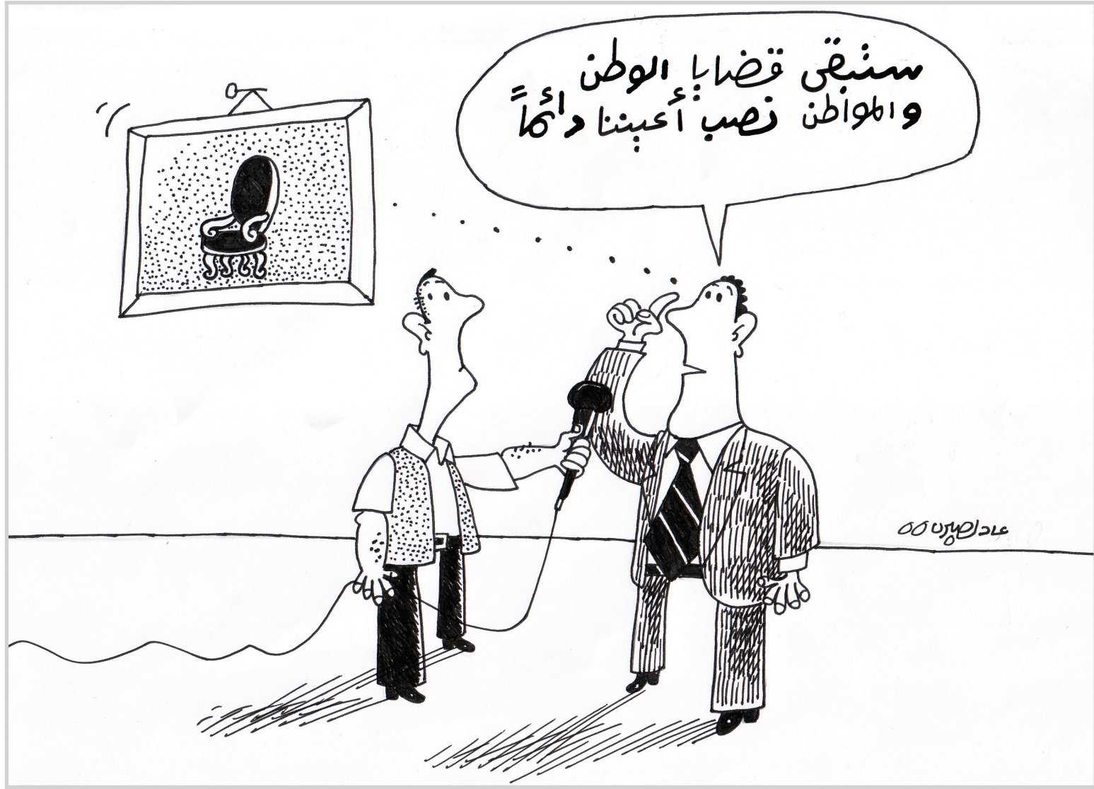
كاريكاتير ..... عادل صبري

سنبقى قضايا الوطن وامواطن نضب أحبنا دائما