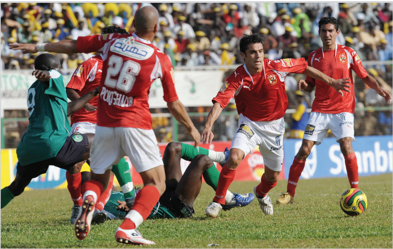
الأهلي يقطع مشواراً مهماً في دوري أبطال إفريقيا