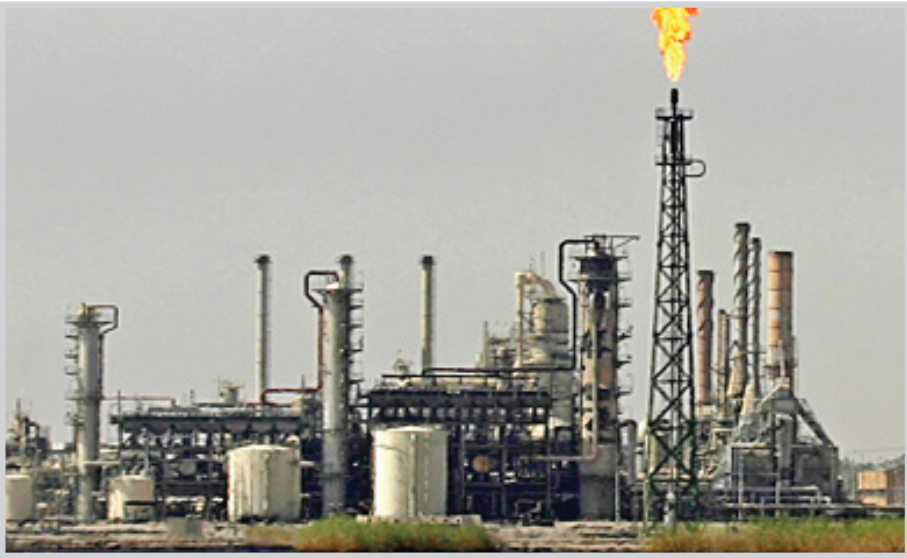
محطة كهرباء في الناصرية

حيث تضمن الامر الوزاري طلباً من القوات الامنية التدخل لغلق مقرات التشكيلات النقابية التي يتمحور دورها في الدفاع عن حقوق العمال والمنتسبين واحتواء المشاكل التي قد تحصل خلال العمل بين الادارة وبعض المنتسبين. وتابع رئيس نقابة عمال كهرباء ذي