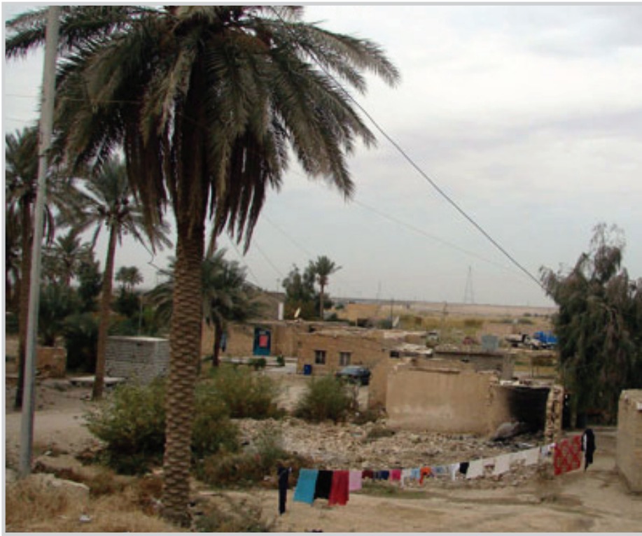
مناطق ريفية بحاجة الى طرق

الموصل / نورت شمدين التقى محافظ نينوى ائيل النجيفي ممثلين عن