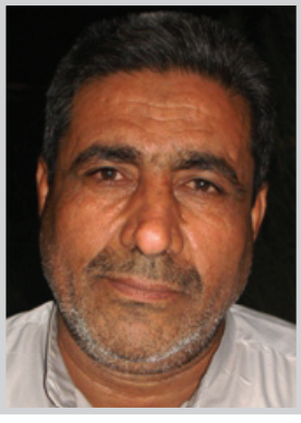
رئيس نقابة عمال كهرباء ذي قار