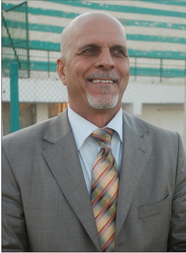
دحلوص ينتقد تباين مستوى الدوري

للموسم ٢٠٠٩ - ٢٠١٠ لامتلاكها اللاعبين الجيدين القادرين على انتزاع الفوز والملاكات التدريبية التي لها القدرة على قراءة اوراق المنافس وايجاد الثغرات التكتيكية في صفوفه: من ابرز تلك الفرق اربيل والقوة الجوية ودهوك والشرطة والنجم وكربلاء والزوراء، ازاء ذلك يتوقع ان تحفل مباريات دوري النخبة بالقوة والتنافس المثير لتقارب المستوى الفني