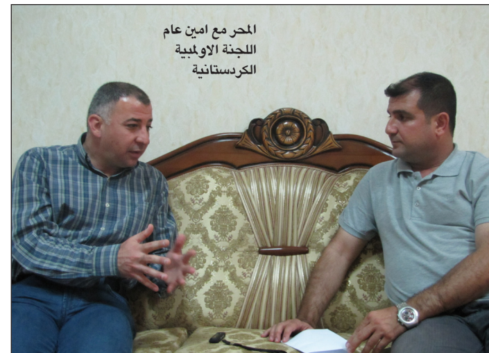
المحرر مع امين عام اللجنة الاولمبية الكردستانية

- يجب ان نراعي الوضع الراهن لأقليم كردستان بشكل خاص وللعراق كافة