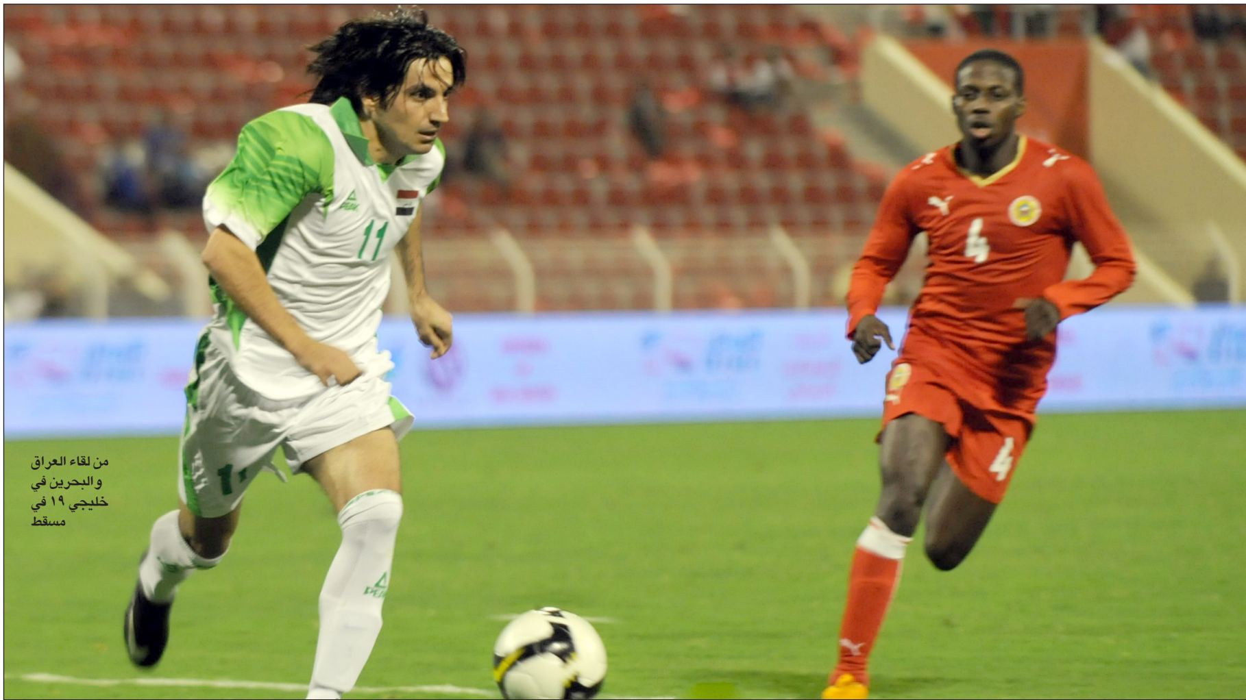
من لقاء العراق والبحرين في خليجي ١٩ في مسقط

الأخير التي اعتمدت على التقرير الذي رفعه الأردني نضال الحديد ممثل فيفا الذي اشرف على مراقبة الانتخابات التي تم تأجيلها الي إشعار آخر بناء على طلب تقدم به ٦٣ عضوا يشكلون الهيئة العامة للاتحاد .