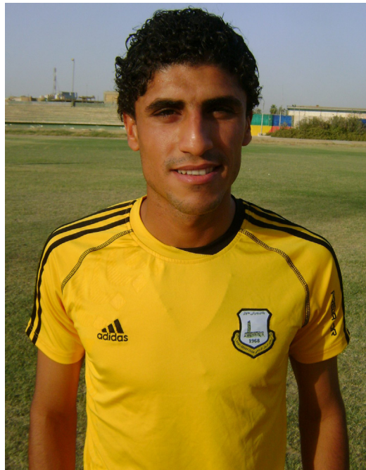
كوبي غير متفائل بمهمة المدرب الاجنبي

بقوة على احراز اللقب . × هل تعتقد ان اربيل قادر على تحقيق النتائج على المستوى الخارجي ايضاً ؟ - أكيد لان الفريق يضم نخبة طيبة من اللاعبين الدوليين القادرين على تقديم مستوى طيب في المحافل الخارجية ولولا الحرمان الذي عانت منه كرتنا هذا الموسم