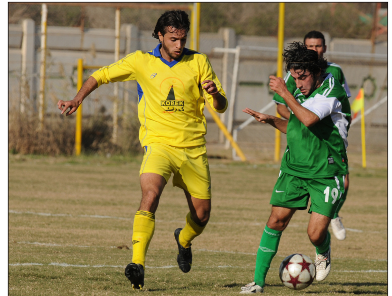
المصافي يجهز شبابه لتحد جديد

وكشف ان عددا من اللاعبين الكسالى الذين مثلوا الفريق سيتم الاستغناء عنهم في ظل عدم تطور مستواهم الفني والذين لم يتسن لنا جني الفائدة منهم إضافة الى ان هناك لاعبين تعرضوا الى اصابات ولم يصلوا مرحلة الشفاء التام حتى الان ما يجعل بقاءهم مع الفريق مهددا .