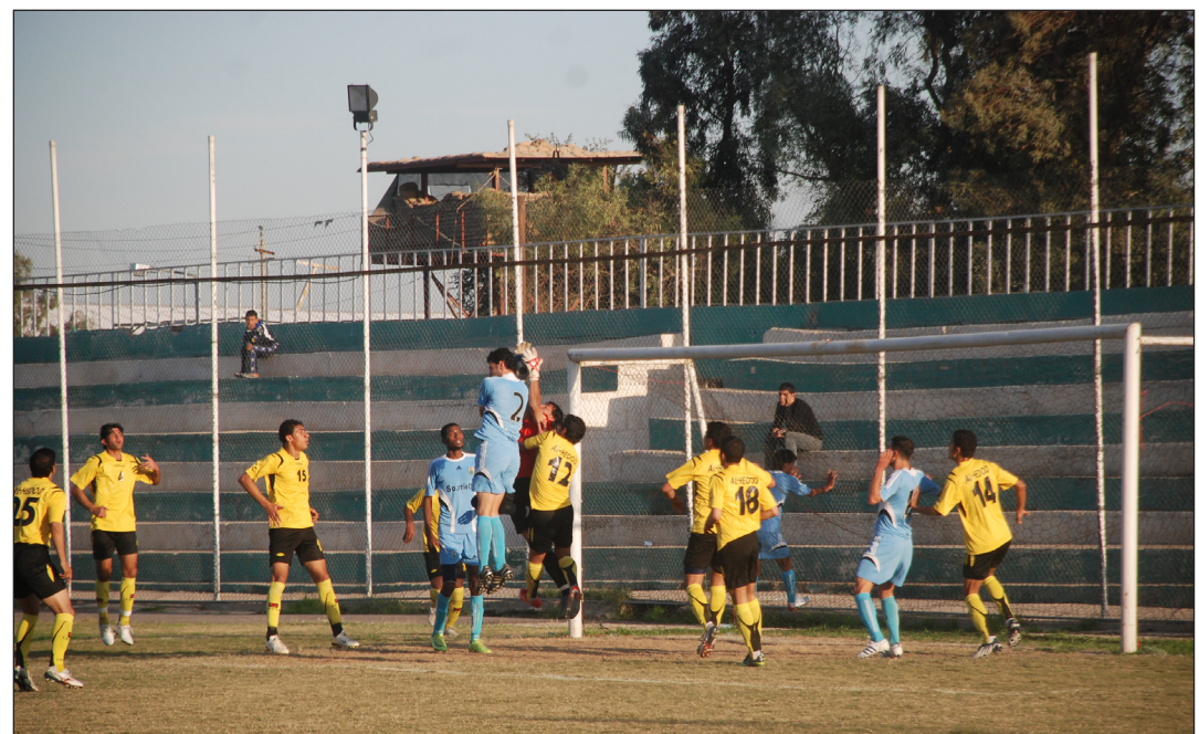
نفط الجنوب يطمح بلوغ المربع الذهبي

وعن اسباب كثرة إهدار الفرص من المهاجمين في المباريات قال رئيس ادارة النادي : يمتلك الفريق ثلاثة