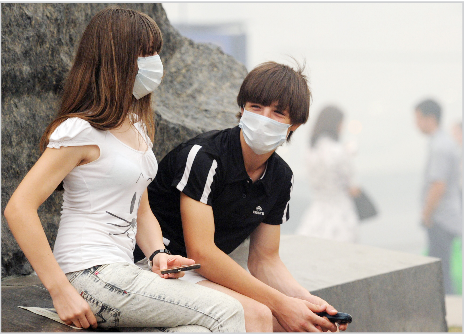
الوقاية من آثار المخان الذي تسبب به حريق الغابات في روسيا.. ا ف ب

رئيس الوزراء الياباني ناوتو كان في خطاب ان «على الجنس البشري عدم تكرار الهول والمعاناة اللذين تسببت بهما الاسلحة النووية». و اضاف ان «اليابان كونها الدولة الوحيدة التي كانت ضحية قصف نووي زمن الحرب، تتحمل مسؤولية اخلاقية ان تكون في طليعة المعركة من اجل بناء عالم خال من الاسلحة النووية». ومثل الولايات المتحدة سفيرها في اليابان جون روس الذي وضع اكليلا من الزهور في ذكرى «جميع ضحايا الحرب العالمية الثانية»، في حضور عكس دعم الرئيس الاميركي باراك اوباما نزع الاسلحة النووية. وقال روس في بيان «من اجل الاجيال القادمة يجب علينا مواصلة العمل معاهد الوصول الى عالم خال من الاسلحة النووية». كذلك حضر الامين العام للامم المتحدة بان كي مون لاول مرة الحفل الذي يقام سنويا في هيروشيما. وقال بان «بالنسبة لعدد كبير منكم يبقى هذا اليوم حيا كالوميض الابيض الذي الهب السماء، وقامت كالظلمة الاسود الذي تلاه». و اضاف «طالما ان الاسلحة الذرية لا تزال موجودة، سنعيش في الظل النووي». ووقف الجميع دقيقة صمت في الساعة ٨:١٥ امس صباحا في اللحظة التي انفجرت فيها القنبلة فوق المدينة. وبعد ذلك ادى عدة هيروشيما تاتوشي اكيبا خطبا ثم اطلقت الف حمامة رمزاً للسلام.