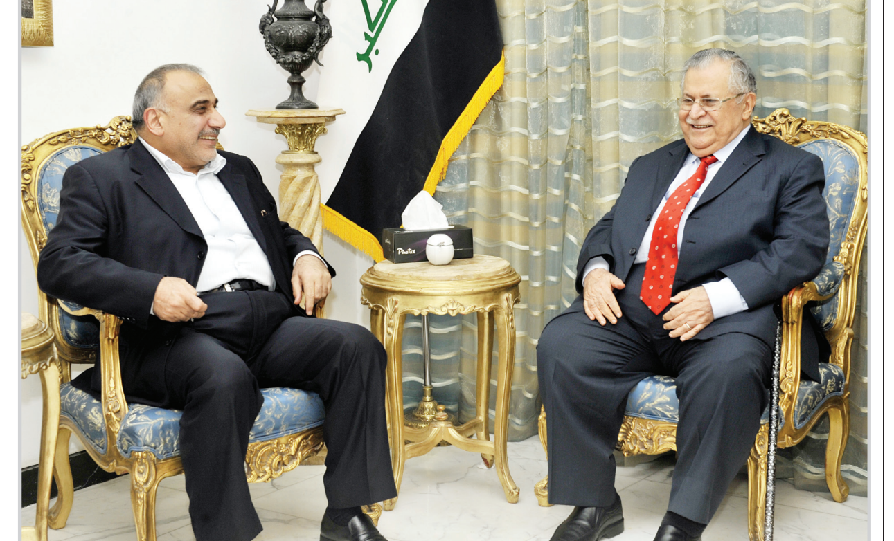
طالباني اثناء لقائه مع نائبه عبد المهدي امس

إلى ذلك شدد الجانبان على ضرورة تكثيف اللقاءات بين القوى السياسية العراقية وضرورة تغليب المصلحة الوطنية العليا على المصالح الفئوية والحزبية.