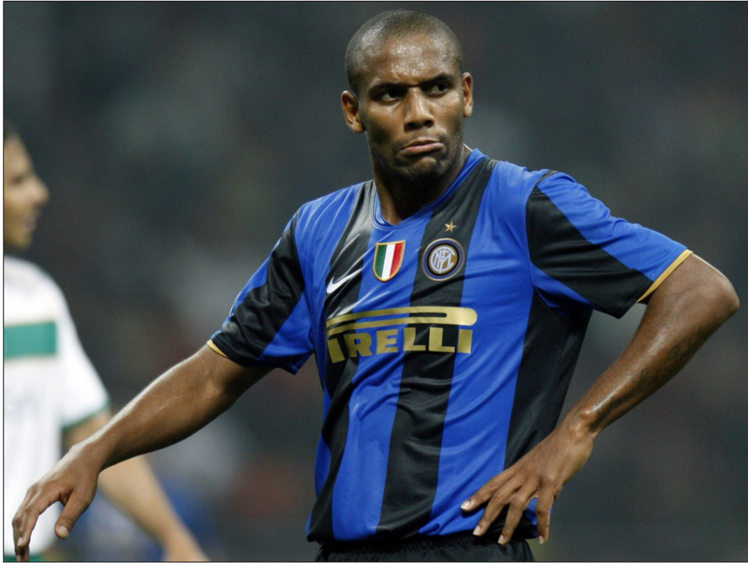
مايكون احرز ثلاثة القاب مع الإنتر

وفي حديثه لـ (الإغازيتا)، قال مايكون: عندما سمعت الناس يتحدثون عن نجاحي، لم أبال بذلك، وربما كان الشيء الوحيد الذي استفدت من ذلك هو أن ذلك أعطاني دفعا نحو العمل بجدية من أجل التآلق وإثبات أنني عند حسن ظن تلك الجماهير.