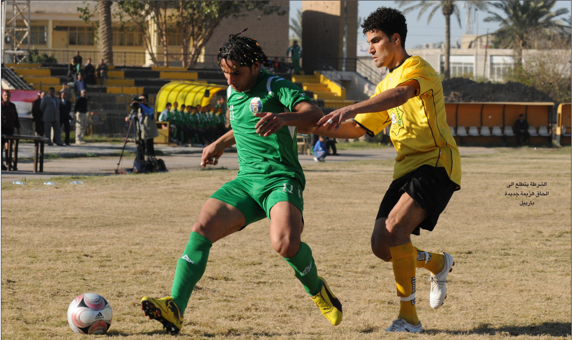
الشرطة يتطلع الى الحاق هزيمة جديدة باربيل

متذيل الترتيب بنقطتين في مباراة يسعى فيها لتأكيد صدارة والمواصلة نحو حجز بطاقة التأهل مستثمرا النتائج المتواضعة التي حققها بغداد والتي ادت الى اقالة مدربة يحيى علوان. ويحل فريق أربيل وصيف بطل المجموعة الثانية ٦ نقاط ضيفا على المتصدر الشرطة برصيد ٧ نقاط في مباراة مهمة لكلا الفريقين لحسم الصدارة ولاسيما ان المباراة الاولى بين الفريقين انتهت لصالح الأخير بهدف نظيف . واوضح ان ثلاث مباريات ستقام على ملاعب المحافظات حيث يستضيف فريق النجف رابع ترتيب المجموعة الثانية بدون نقاط فريق الكهراء الثالث برصيد ٤ نقاط ويلعب فريق نبط الجنوب رابع ترتيب المجموعة الثالثة بدون نقاط مع فريق كربلاء ثالث ترتيب المجموعة برصيد ٤ نقاط بينما يحل فريق القوة الجوية وصيف بطل المجموعة ضيفا على فريق دهوك متصدر المجموعة برصيد ٧ نقاط .