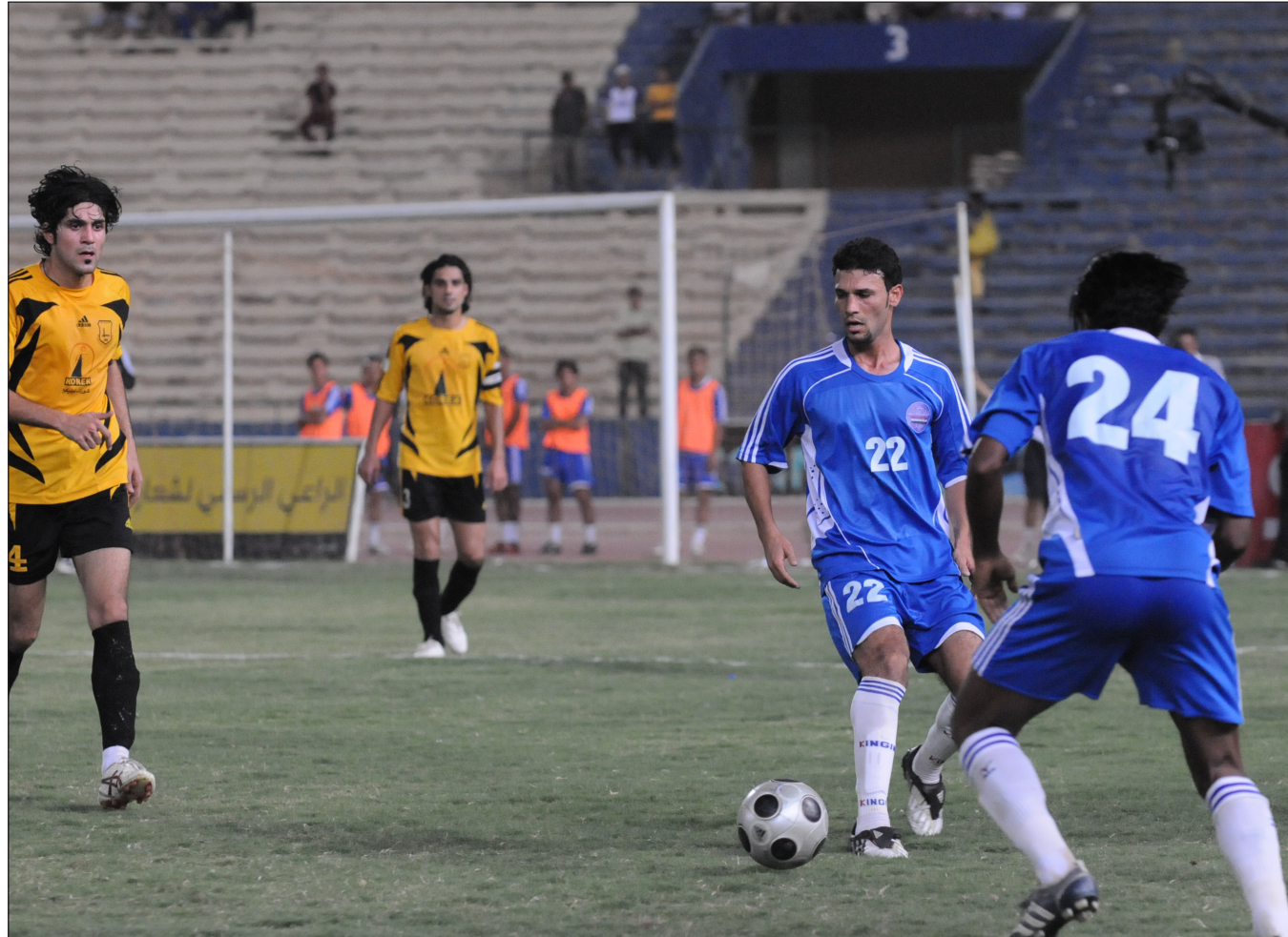
النجف يخيب امال جماهيره في دوري النخبة

وأضاف: ان آلية الدوري التي تم اعتمادها من قبل اتحاد الكرة العراقي لم تكن موفقة ولم تنصف فريقنا فكيف لنا ان نلاعب فرقا احتلت المراكز قبل الاخيرة في مجاميعها ونحن ثاني المجموعة الجنوبية حيث وضعتنا القرعة مع فريقي الشرطة والكهرياء اللذين احتلا المركز الخامس في مجاميعهم وهذا بحد ذاته يعد غيبنا لنا، فكيف لنا ان نواجه فرقا تفوقها في الترتيب واليوم هي من تنصدر مجموعتنا؟ فهذا لا يمكن اي ان هناك خطأ في التخطيط لهذا الدوري . وأكد الكرعاوي ان دورينا متعب جدا وممل بالوقت نفسه فلا يوجد دوري في العالم كله يمتد لسنة وشهرين مشيرا الى ان منغصات اعترضت طريقه فكلما يصعد الخط البياني لفريق النجف وكذلك بعض الفرق الأخرى التي تعاني ما نعانیه نرى ان الدوري قد توقف نتيجة حدوث أزمة جديدة تكاد تطيح بأماننا وبعد فترة من الزمن يعاود الدوري مسيرته ونعود مجددا نعد الفريق كي يصل الى المستوى الذي أوصلناه له بالامس وهكذا . وأشار الكرعاوي اننا في نادي النجف لم نحمل اياً