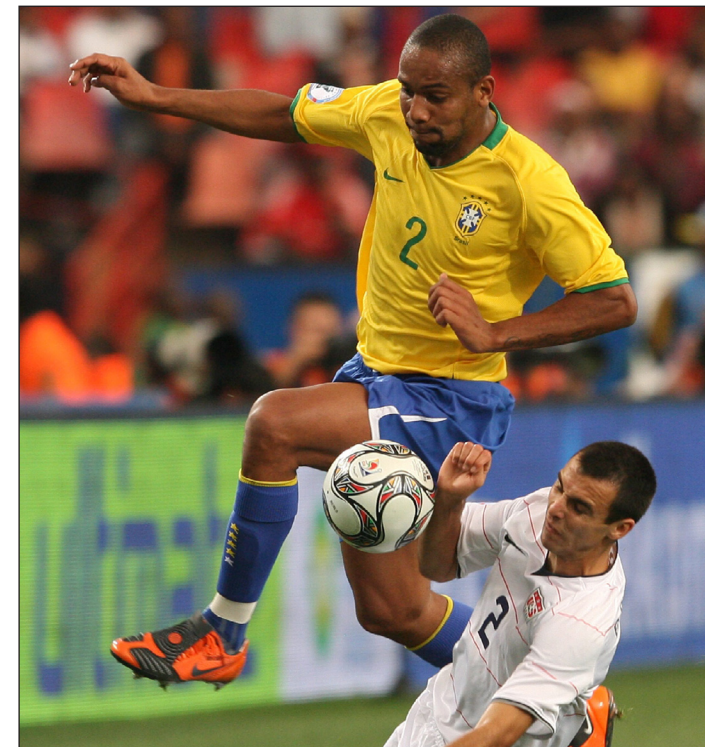
يجتاز احد لاعبي امريكا في مونديال ٢٠١٠

مايكون لا يمكن أن ينسى اللحظة الفارقة التي صنعت مجده يوم ٢٥ تموز ٢٠٠٤ عندما واجهت البرازيل منافسها اللدود الأرجنتيني في نهائي كأس كوبا- أميركا. ونعود إلى الوراء قليلاً قبل انطلاق البطولة عندما اختار كارلوس ألبرتو باريرا مدرب راقصي السامبا المشاركة في كأس أميركا الجنوبية بفريق من الصف الثاني بعد أن ترك العديد من نجوم المنتخب البرازيلي الذين فازوا بكأس العالم قبل سنتين،