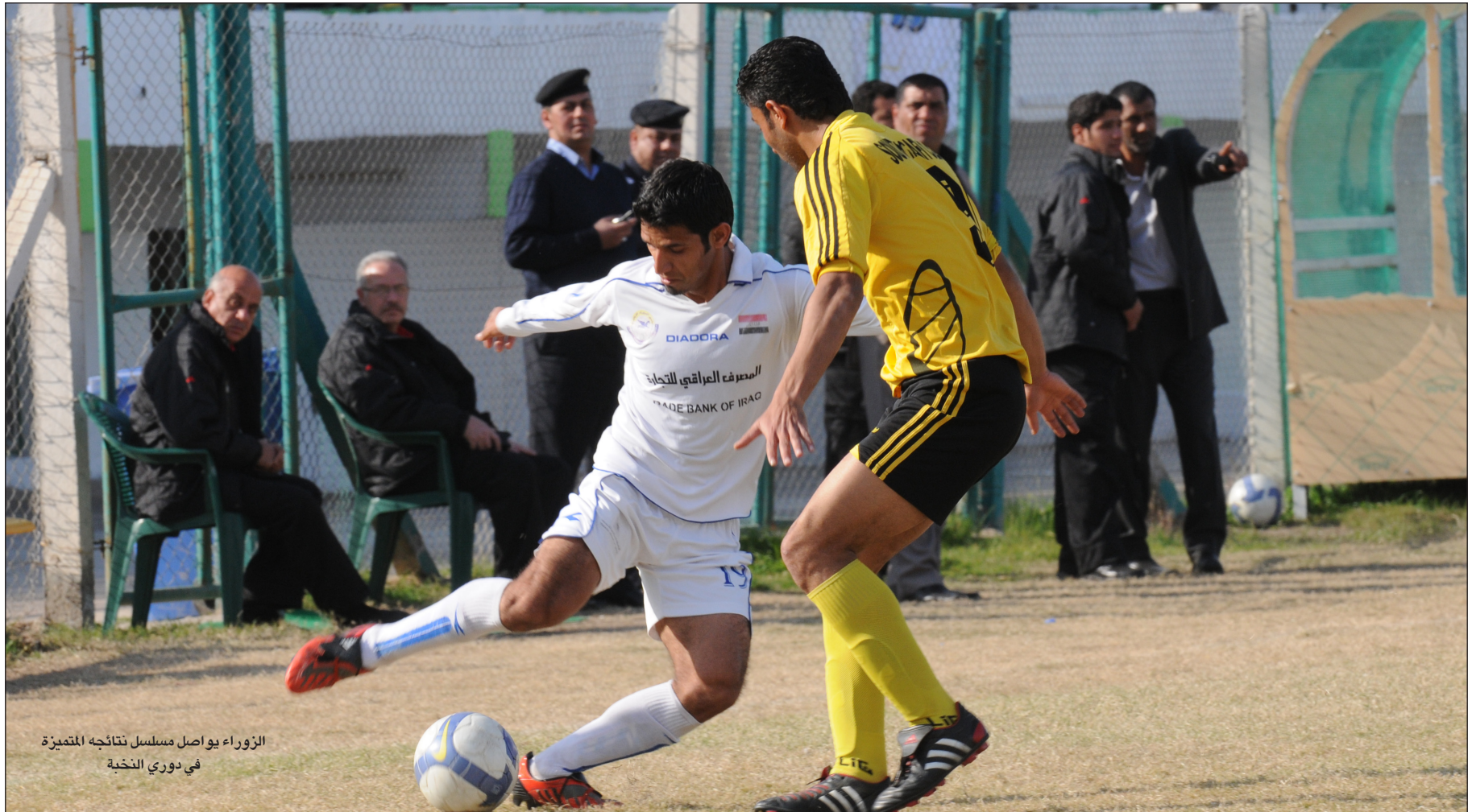
الزوراء يواصل مسلسل نتائجه المتميزة في دوري النخبة

لأسيما أنه قدم لمحات كروية جميلة وفرض أسلوبه التكتيكي على مجريات المباريات التي خسرها أمام فرقي أربيل والشرطة، وبذلك فإن مهمته غزلان البادية في المرحلة الثانية من دوري النخبة تكتنفها الصعوبة لأن فقدان أية نقطة من المباريات الثلاث المتبقية يعني نهاية حلم الانتقال إلى المربع الذهبي. وأكدت الخسارة أمام الشرطة بهدف واحد أن الفريق بحاجة ماسة إلى المزيد من الجرعات المعنوية للاعبين لإعادة الثقة بإمكاناتهم الفنية والبدنية المعززة بالمعالجات التكتيكية المناسبة مع ضرورة زيادة الوحدات التدريبية للمهاجمين كي يستطيع غزلان البادية العودة إلى تحقيق الانتصارات ومصالحه الجماهير لكسب المزيد من النقاط لدخول المنافسة من أوسع ابوابها لاسيما أن غزلان البادية يمتلك مدرباً جيداً هو عبد الغني شهد له تجارب ناجحة مع الفريق ويضم لاعبين على قدر عالٍ من المهارات الفردية العالية وجماهير يشجع بطريقة حماسية تحفز اللاعبين على انتزاع الفوز من أنياب المنافس.