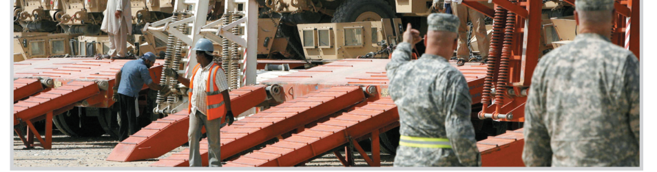
اليات لسحب معدات الجيش الاميركي من العراق.. آ ف ب

وتتضمن الورقة الكردستانية التي طرحها الوفد المفاوض منذ بدء جولة مفاوضات في منتصف حزيران الماضي ١٩ بندا في ورقة عمل سلمت للكتل السياسية منوها الى ان من يوافق عليها سيكون قريبا جدا من التحالف معه، ومنها ايجاد حلول مع الحكومة الاتحادية بشأن العقود النفطية ومسألة ميزانية حرس