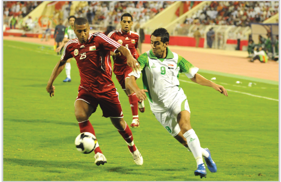
جانب من لقاء العراق وعمان في خليجي مسقط

أوقعت قرعة دورة كأس الخليج العربي لكرة القدم العشرين - المقرر إقامتها في مدينتي عدن وأبين خلال الفترة من الثاني والعشرين من شهر تشرين الثاني ولغاية الخامس من شهر كانون الأول المقبلين التي سحبت في قاعة فندق (جولد مور) بمدينة عدن اليمنية - منتخبنا الوطني في المجموعة الثانية إلى جانب منتخبات سلطنة عُمان حامل لقب النسخة الأخيرة من الدورة والإمارات والبحرين، فيما ضمت المجموعة الأولى منتخبات قطر وعمان تم توزيع المنتخبات على اليمين (المنيف) والكويت والسعودية وثلاثة مستويين حسب آخر تصنيف صادر من فيفا لشهر آب الجاري.. ومثل العراق في حفل القرعة طارق احمد أمين السر العام للاتحاد العراقي المركزي لكرة القدم إلى جانب العديد من ممثلي الاتحادات في منظمة الخليج والوطن العربي والعديد من القيادات الرياضية والإعلامية ونجوم الكرة العربية والخليجية. وحضر مراسم حفل القرعة رئيس الاتحاد الآسيوي محمد بن همام ورئيس الاتحاد المصري سمير زاهر، وأمين عام الاتحاد العربي سعيد جعمان. وستقام مباريات البطولة في ثلاثة ملاعب هي ملعب ٢٢ مايو الذي سيحتضن افتتاح بطولة البطولة وملعب الوحدة والشلال بمحافظة عدن وأبين، وهناك أربعة ملاعب هي سمسان والشعلة والنصر والمصورة