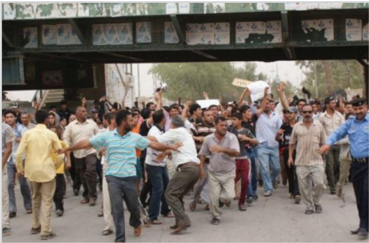
احدى التظاهرات في الناصرية (صورة من الارشيف)

١٦ شخصا بجروح بينهم عدد من عناصر الشرطة. ومن جهة اكد احد المارة تعرضه هو وقريبه للحجز بضع ساعات في إحدى المردعات العسكرية التي تستخدمها القوات الامنية وذلك عندما ابدوا تدمرهم مما حصل لهم ولغيرهم من اذى على يد الشرطة رغم أنهم لم يكونوا من المشاركين في التظاهرة السلمية. وفي السياق ذاته أكد احد اصحاب المحال التجارية في شارع الجبوبي تعرض العديد من محال المواد الغذائية والأجهزة الكهربائية في الشارع المذكور لاضرار وخسائر كبيرة نتيجة الاستخدام المفرط لخرائط المياه. وإزاء ذلك أعرب عدد من قادة الرأي والشخصيات الاعلامية عن استيائهم