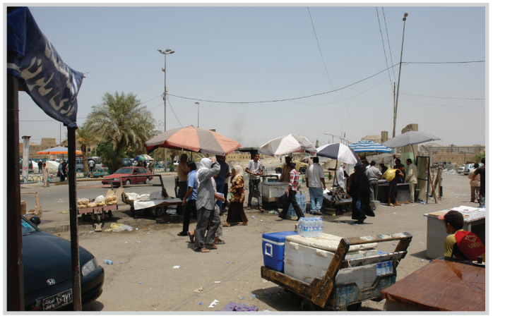
تجاوزات على الارصفة...