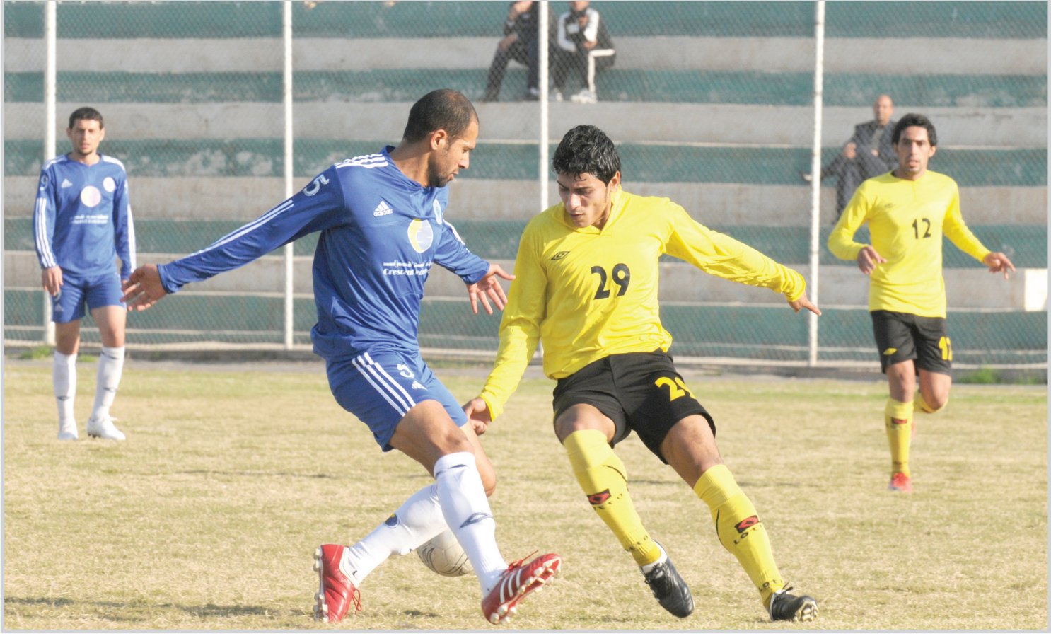
دهوك يسجل نتيجة كبيرة في شبك الزوراء.