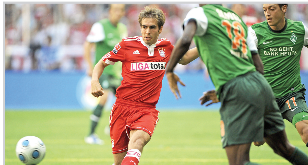
بايرن ميونخ يخفق امام كايزر سلوترن