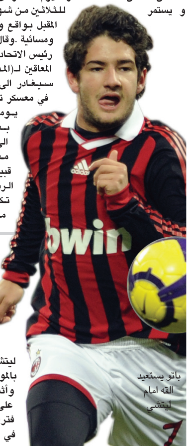
باتو تاستيدي اللقب امام ليتشي