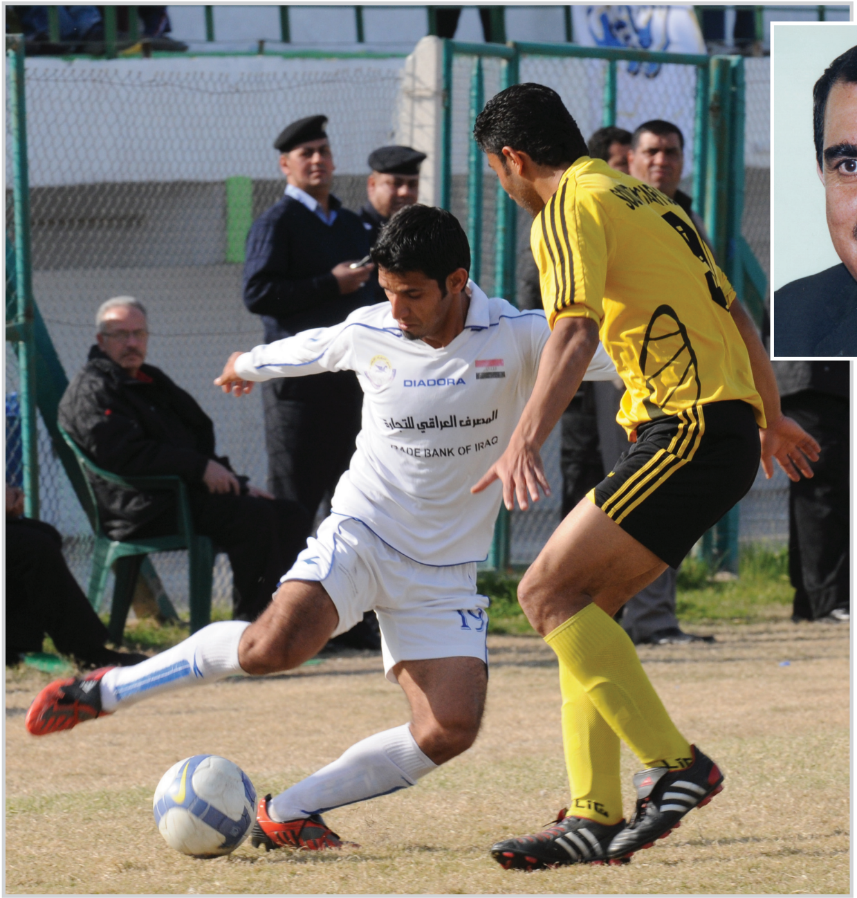
الزوراء يواصل تدربياته بانتظار قرار حاسم من اتحاد الكرة