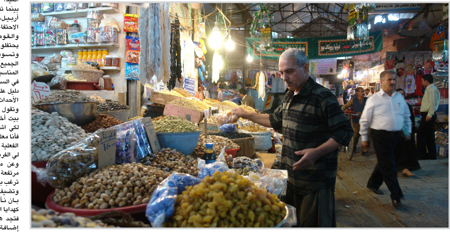
أربيل محط أنظار العوائل العراقية.. وأسواقها تلبى احتياجاتهم

مع اقتراب العيد، يزداد الإقبال على التسوق خاصة من قبل النساء من أجل اقتناء ما يحتاجن إليه، خصوصاً الأطفال لاسيما وان العيد، لكنهن الآن يركزن على شراء المواد الداخلة في صناعة الكليجة التي تعتبر طبق الضيافة الأساسي في العيد، لذا فان أسواق أربيل تكون مززحة في هذه الأوقات.