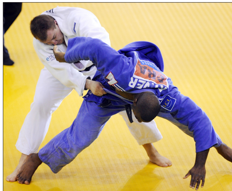
جانب من بطولة العرب التي اقيمت في لبنان

وأضاف: ان لدينا مجموعة من اللاعبين الأكفاء الذين نعول عليهم في تسجيل حضور جيد في