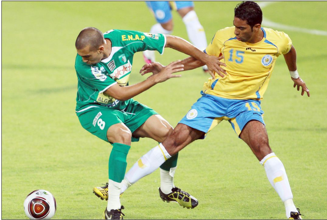
انفراج أزمة الأندية المصرية في البطولات القارية