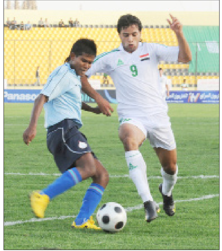
جانب من تصفيات آسيا للشباب التي اقيمت في اربيل