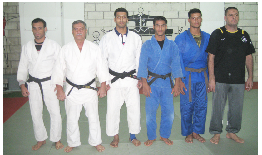
عدد من ابطال الجودو ببطولة العرب في بيروت

الوطني للجودو حاليا في مدينة أربيل لخوض منافسات بطولة العالم باللعبة التي ستقام في السادس من شهر أيلول الجاري، وبعد عودته من هذه البطولة ستكون اللجنة الاولمبية الوطنية العراقية قد حددت لنا اماكن المعسكرات الخاصة بالدورة، ما يجعل لاعبيننا مؤهلين لخوض تلك المنافسات بعد انخراطهم بمعسكرات داخلية وخارجية ليكونوا على أهبة الاستعداد لهذه البطولة التي نأمل من خلالها ان يحقق لاعبوننا نتائج ايجابية تليق باسم العراق.