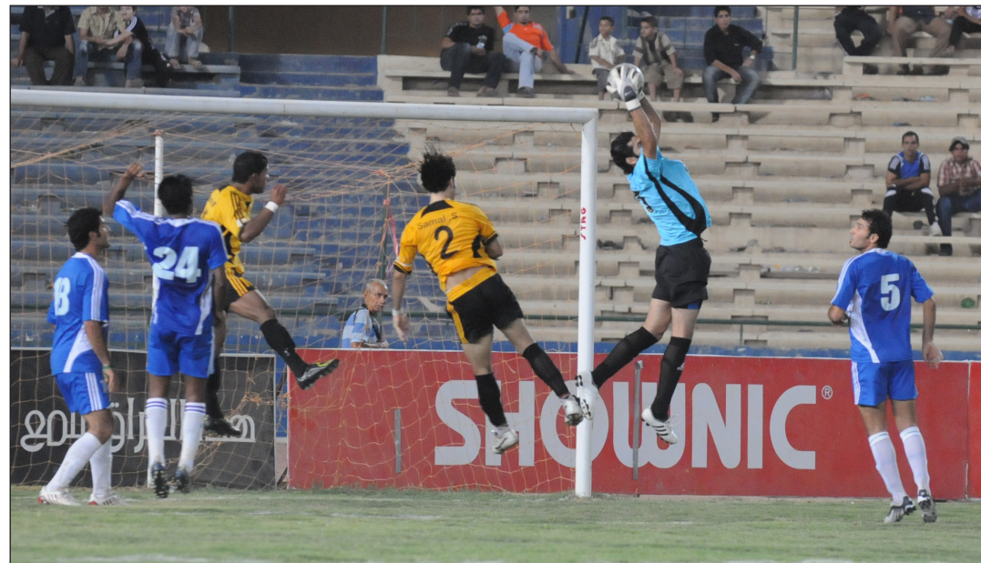
دوري الكرة يتمتع بوجود حراس مهرة وثقاة

× كيف تقيّم الحراس في كأس العالم الاخيرة؟