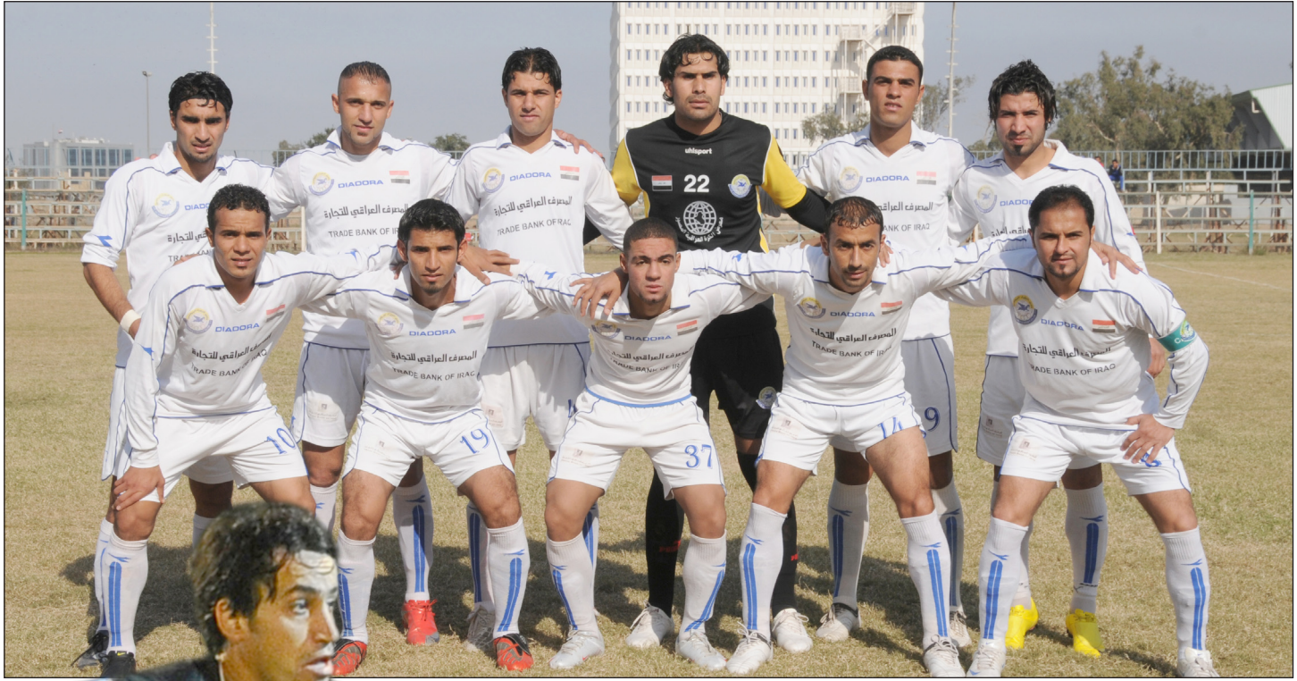
الزوراء تلقى هزيمة مريرة أمام دهوك