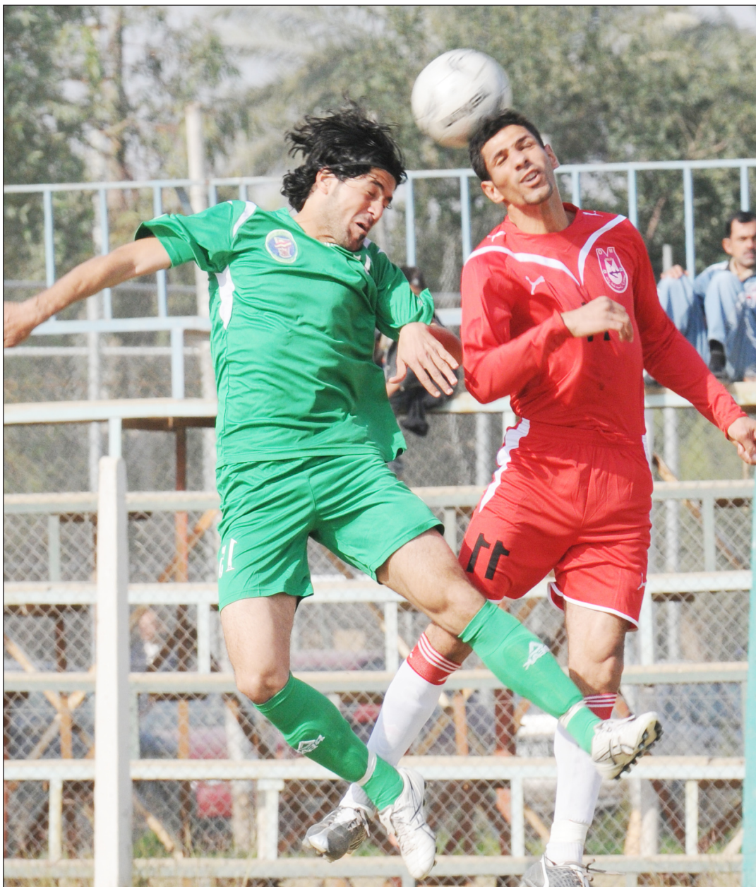
الاندية الرياضية بحاجة الى تنسيق اعمالها مع الاتحادات

للاتحادات، بل تحولت الى (دكاكين) للمناجرة والاستهلاك واصبح الأمر بالعكس الاتحادات تكتشف النجم وترعاه والاندية يقيم عملها وفق نظام التنقيط من وزارة الشباب والرياضة وتقبض المال. × كان لك دور في أزمة الكرة بتقديم مبادرة لكنها رفضت لماذا ؟