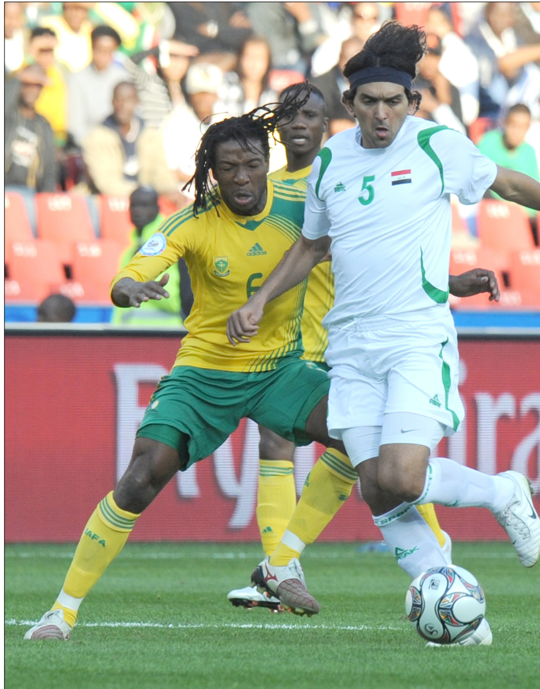
منتخبنا الوطني يكتف استعداداته لبطولة غرب آسيا

استعداداته للبطولة في الثالث عشر وحتى الحادي والعشرين من الشهر الجاري ، خلال معسكر داخلي يُقام على ملعب الشهيد فيصل الحسيني، قبل التوجه في الثاني والعشرين من الشهر ذاته إلى العاصمة الأردنية عمان. وأشار بزاز إلى أنه خلال المعسكر الداخلي سيختار (20) لاعبا من القائمة التي تضم