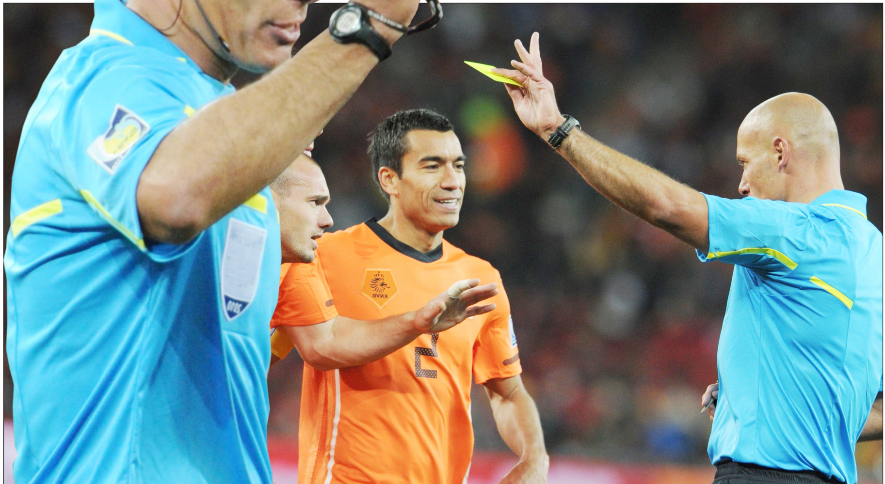
اثناء اشهار الكارت الاصفر في وجه احد لاعبي هولندا

وتابع: "أحد الاشياء التي كنت سأغيرها هو لون البطاقة التي تلقاها دي يونغ بعد الالتحام. واستطرد: بعد رؤية الواقعة مرات عدة بالحركة البطيئة ومن زوايا مختلفة وأنا جالس على الكرسي في منزلي بوسعي ان اقول انها مخالفة تستحق بطاقة حمراء، لكن قراري في ذلك الوقت بعدم طرد اللاعب لم يكن بسبب اني لا اريد ان اطرد شخصاً ما من نهائي كأس العالم ولكن كان بالاعتماد على زاوية الرؤية." وادرف: "ما لم استطع ان اراه هو الاحتكاك الفعلي مع الونسو من ظهر اللاعب مع وجود