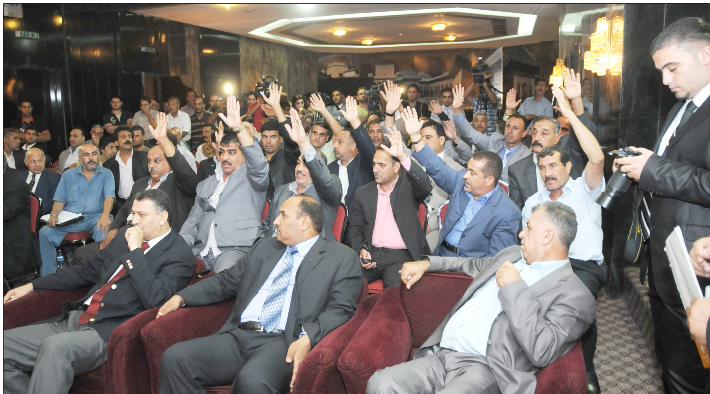
الهيئة العامة لاتحاد الكرة مسؤولة عن إقرار مصير الانتخابات

حاوره / عدي المختار × بعد عامين من انبثاق اللجنة الاولمبية، هل تشعر انك حققت ما تصبو اليه؟ - بصراحة لا، لأن السنة الماضية انقضت بترميم البيت الاولمبي من الداخل وبالنسبة لنا كانت مساحة للاندماج مع الاخوة في المكتب التنفيذي لتعلم العمل الاولمبي وما