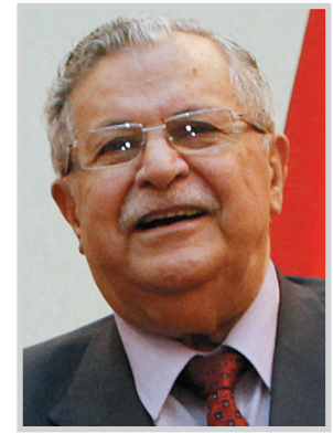
□ بغداد / المدى

بعث رئيس الجمهورية جلال طالباني برفيقة تهنئة إلى الرئيس البرازيلي لويس إناسيولولا داسيلفا بمناسبة ذكرى يوم عيد الاستقلال، وفي ما يلي نص البرقية: