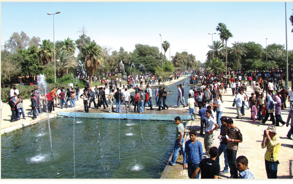
(لمة) الاحبة والأصدقاء، ام هدى جاءت بصحبة زوجها واولادها

(اخيرة المدى) تجولت مع المحققين في عدد من الاماكن لتتقل صور الاحتفال بالعيد وكانت جولتنا