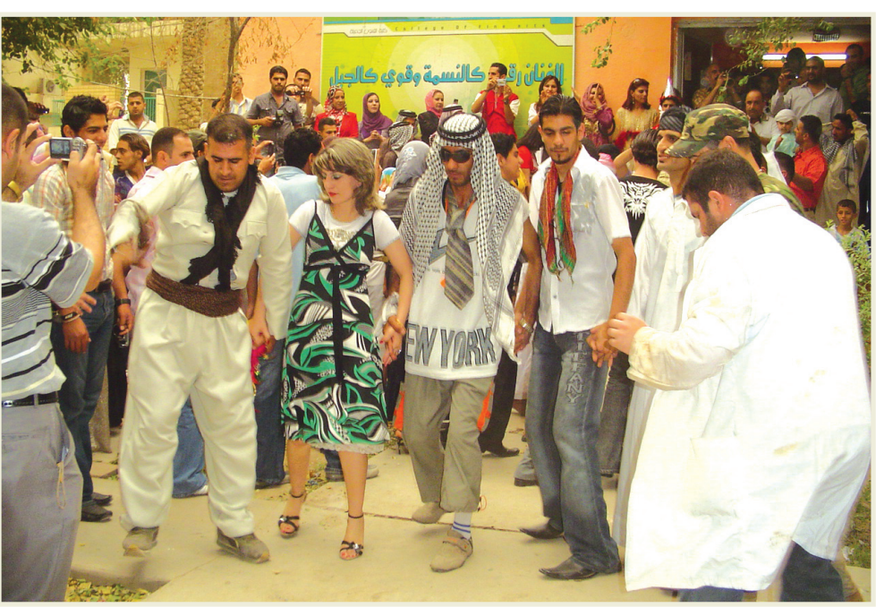
□ بغداد / أفراح شوقي

والفرح بين جموع المحققين ويكفي أن تشبك يدك بأيديهم حتى تصير منهم وإن لم تكن منقشاً أصول أداء تلك الديكات، الشباب كانوا يتصدر الراقصين ملوحاً بسبحة يده التي راح يهزها في حركة دائرية متقنة وهو يهز كتفيه فرحاً قال: رقصة الجوبي أو (الديكة) هي أجمل الرقصات الشعبية التي تحمل معاني كثيرة من بينها التعبير عن الفرح والألفة والتسامح، وبإمكان الجميع ممارستها دون تردد وكثيراً ما تجمع الصغار والكبار معاً. أم أطراف أصرت على أن تشارك في الاحتفالين رقصتهم ولو أنها لا تجيد الرقصة قالت: كنت سعيدة بأجواء الفرح في العيد وأحببت أن أمارس مع أولادي تلك الرقصة وأجدها قد وحدت بين العراقيين وكسرت قيد الطائفية التي أراد الآخرون إيقاعها في شرنا كما والمغرب حسام الأمير قال: غالباً ما يطلب جمهور المحققين أداء أغاني الديكات والرقص على أنغامها وهي تلم جميع الحاضرين حتى النساء