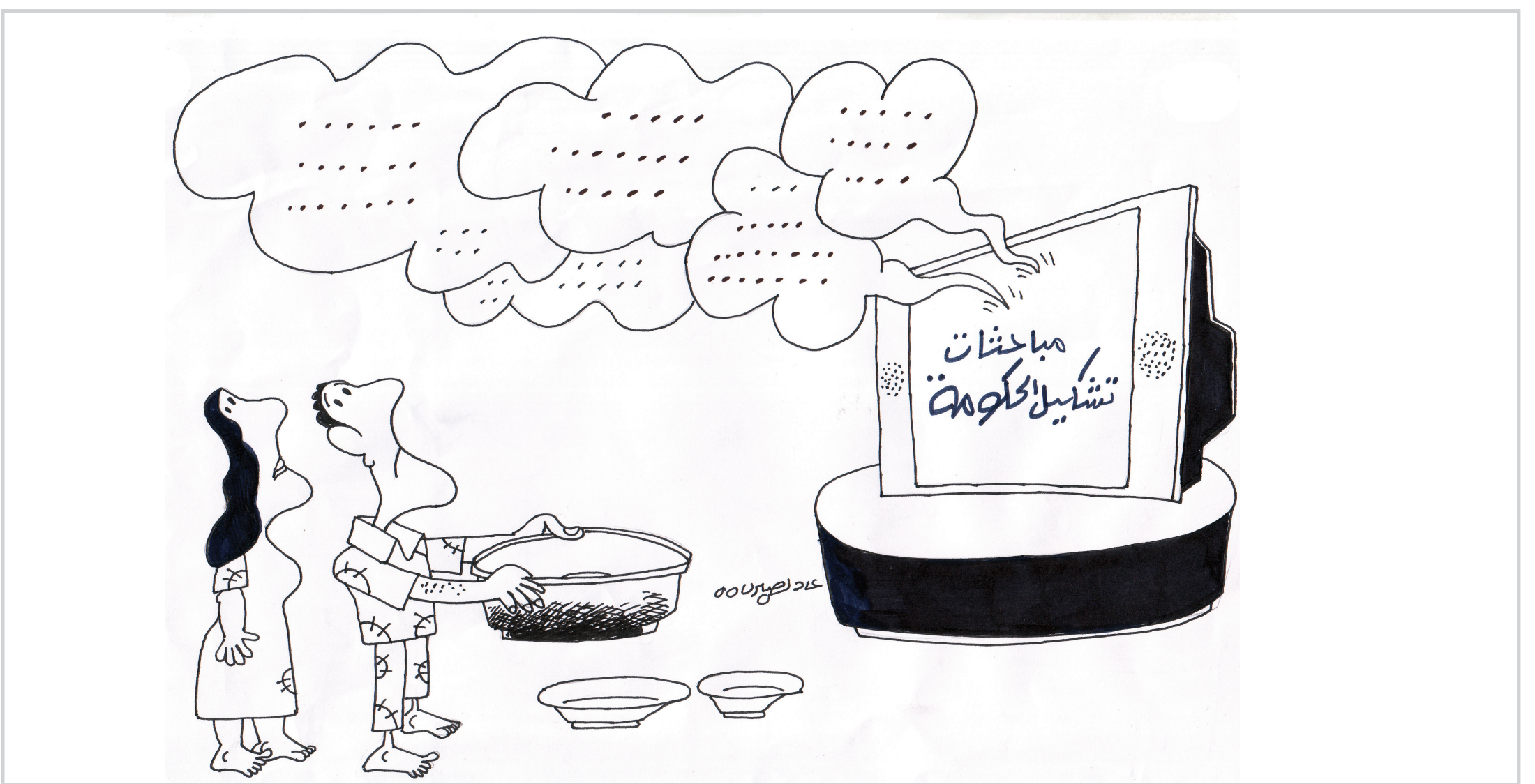
كاريكاتير ..... عادل صيري

مع بدء العام الدراسي الجديد، لم تنتهي سوى أيام قليلة لتبدأ فصول صفحة جديدة من معاناة الناس من ذوي الدخل الواسعة والمحدودة، الرزي المدرسي والحقيبة المدرسية والقرطاسية، ومن ثم كتب المناهج الدراسية الناقصة.. ومثلما اعتاد الطلبة وذويهم في كل مدخل عام دراسي جديد، فإن كلف الانتظام في الدوام المدرسي ختصر لهم الجديد دائما من المصروفات التي هي من شأن القيمين على قانون التعليم المجاني.. وسيد الألباء والأبناء مثل كل بداية عام دراسي، ان المفردات التي ينبغي لهم شراؤها لحاجتهم اليها، سيدونها مبنوثة في السوق السوداء من دون ان يكلف احدا من باعته، موظفين رسميين وأهال، مسح عبارة (يوزع مجاناً) من عليها، فضلا عن كتب المنهج الدراسي، التي تباع بأسعار فوق خيالية، وتنصدر اغلفتها عبارة (الجمهورية العراقية - وزارة التربية).. ماسبق ملح واحد من عشرات الملامح التي تنضح بها معاناة الشرائح المحدودة الدخل ازاء مكابذات فذات اكبادهم كل عام دراسي، فهناك الاكتظاظ الذي بلغ اشده في العام الماضي، والمحدودية الشديدة في عدد البنية، والخدمات الصحية المقفولة،... وكل عام والتربية بخير.