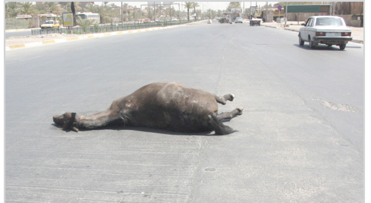
مشهد الشارع في الساعات الأولى من الصباح، يعث، بمشاعر السكينة والسلام، مؤطرة بركة نسائم الصباح العذبة، والخيط الاولى لأشعة الشمس مباشرة بمقدم يوم جديد... قف. هناك جثة!!!!