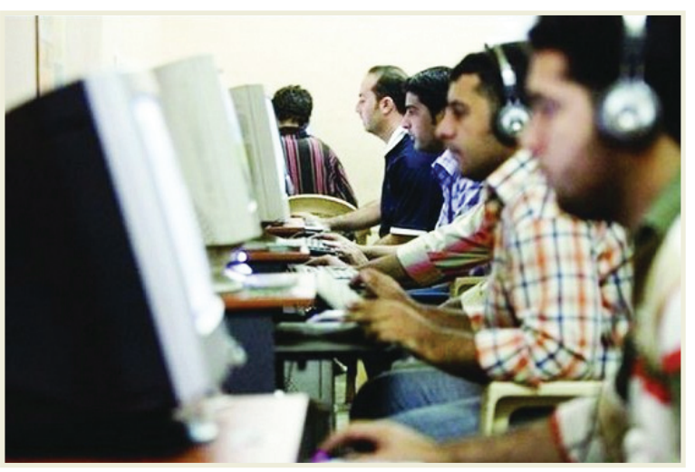
بالدرشة مع صاحبه ويقول: الرديشة أمر مسهل، تستطيع أن تقول ما تريد وتحدث في ساعات يوميا أمام شاشة الحاسبة يقضيها ما تريد من دون خجل أو خوف من ردة فعل

الحادية عشرة مساءً بالتصفيح لهذه الشبكة وتتوزع الشرائح الاجتماعية التي تزور المقهى بين الفئات العمرية المختلفة لكن الأغلب هي شريحة الشباب من كلا الجنسين الذين يجدون المقهى من اسهل الطرق للتواصل مع العالم، وأضاف: أغلب الشباب الذين يرتادون المقهى لديهم هذه الخدمة التي بيوتهم لكنهم يبحثون عن الخصوصية التي توفرها لهم هذه المقاهي، التي غالبا ما تجدها مهياة لذلك من جو شعاعي وأضواء خافتة وتجهيز المكان بحيث لا يطلع أحد على الجالس بجانبه. في محل آخر لا يبعد عن الاول سوى امتار قليلة التقيت صاحبه الذي قال: أن امتلاكه مقهى انترنت اضافة له الكثير على المستوى الشخصي حيث أصبح يجيد التعامل مع الناس كما وأصبح له العديد من الأصدقاء من مختلف الأعمار. وعن أكثر المواقع تصفحا قال: الاهتمام بالو كع يتخلف حسب ثقافة الشخص وحاجته، فهناك من يرتاد مقهانا للاستفادة من مواقع المعلومات، وتصفح الكتب الأدبية والعلمية، وهناك من يفضل مواقع التسلية واللهو، كمواقع التعارف والمراسلة وغيرها.