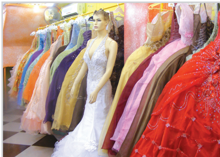
المولدة، وليس فقط فساتين الأعراس والسهرة ما تقوم بتأجيره بل (دواغ) العروس وهو

ليجأ أصحاب الدخل المحدود عادة إلى استئجار فساتين الأعراس والمناسبات الخاصة من المحال التي تقدم هذه الخدمة، بدلاً من شرائها بأسعار مرتفعة الثمن الليلة واحدة فقط، ثم يوضع في خزانة الملابس بقية العمر. وفي ظل زيادة الطلب على إيجار فساتين الزفاف انتشرت العديد من المحال التي تسعى دائماً إلى إرضاء العروس وتراعي إمكانيات العريس المالية. في شارع فلسطين دخلنا إلى أحد تلك المحال فوجدنا صاحبة متجرها مهنيهاً في ترتيب بضاعتها الواصلة نواً للمحل فساتينها عليها وأجابتنا بأنها فساتين أعراس للتأجير وأضاف: أصبحنا نعتمد أكثر على إيجار الفساتين كي نستطيع الاستمرار في عملنا، إما عن أسعارها فقال: تختلف الأسعار من فستان إلى آخر حسب الموديل وسعره ومدى حداثة ونظافته فهناك فستان أول لبسة وثنائي لبسة، كما أن أسعار فساتين الأعراس أغلى من فساتين السهرة