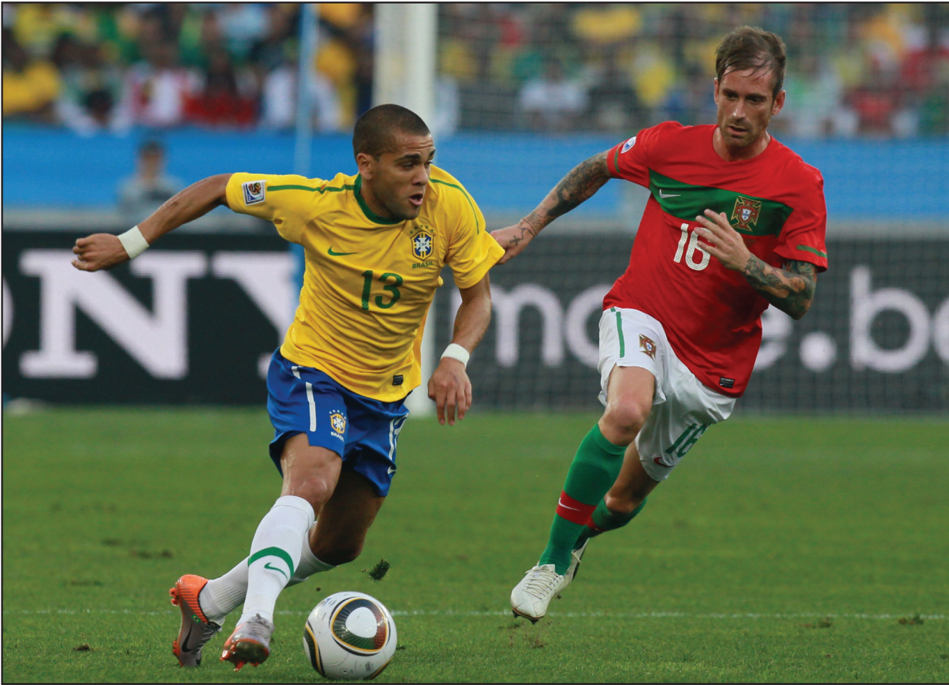
البرازيل هزم أوكرانيا بهدفين نظيفين