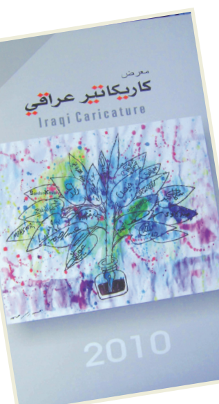
وتنظيماً كأنها ابنة المرحلة الابنية وستبقى شاهداً على ما أصاب الشعب العراقي وبقي بالرغم منها صامداً ومتحدياً لكل الأوجاع والظروف.