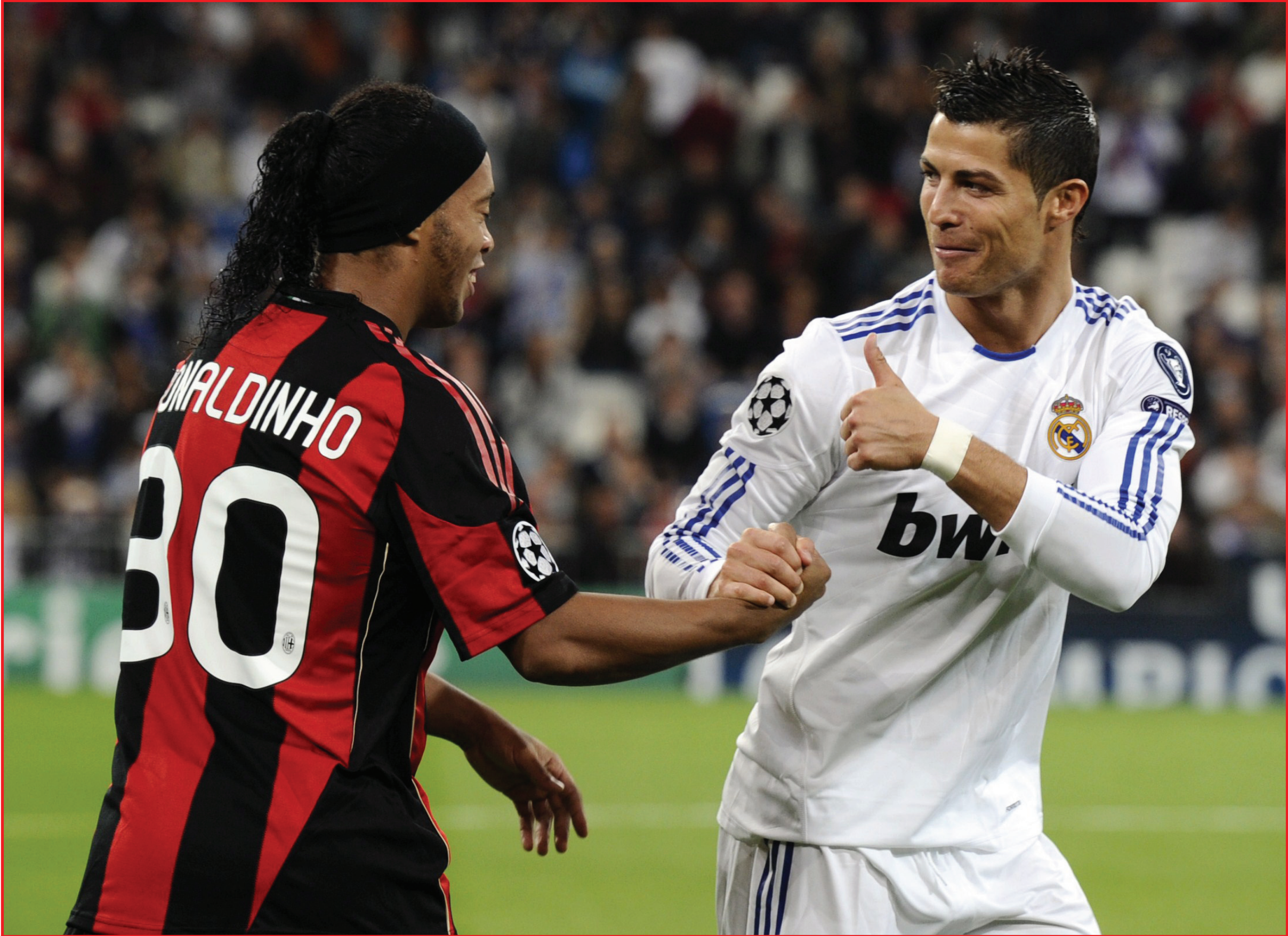
رونالدو يكسب رهانه مع رونالدينو في موقعة برنابيو

الألعاب الأولمبية ٢٠٠٨ في بكين، حيث تقام ١١ مواجهة بنظام الذهاب والإياب يومي ٢٣ شباط و ٩ آذار ٢٠١١ على أن تتأهل المنتخبات الفائزة الى الدور الثاني بمشاركة المنتخبات الـ ١١ الفائزة مع اصحاب المراكز الاعلى في التصنيف البالغ عددها ١٣ منتخباً، بحيث تقام ١٢ مواجهة وفق نظام الذهاب والإياب يومي ١٩ و ٢٣ حزيران ٢٠١١. يشار إلى أن المنتخبات المتأهلة للدور الثاني ذات التصنيف ( ١ - ١٣) : كوريا الجنوبية ، أستراليا، الصين، اليابان، العراق، البحرين، قطر، السعودية، كوريا الشمالية، سوريا، لبنان، أوزبكستان وفيتنام.