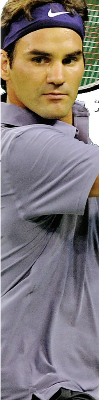
فيدرر مسيرة حافلة بالإنجازات