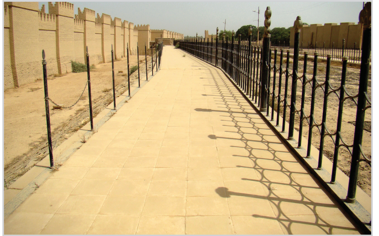
من أجل الحفاظ على مواقعنا الأثرية..!