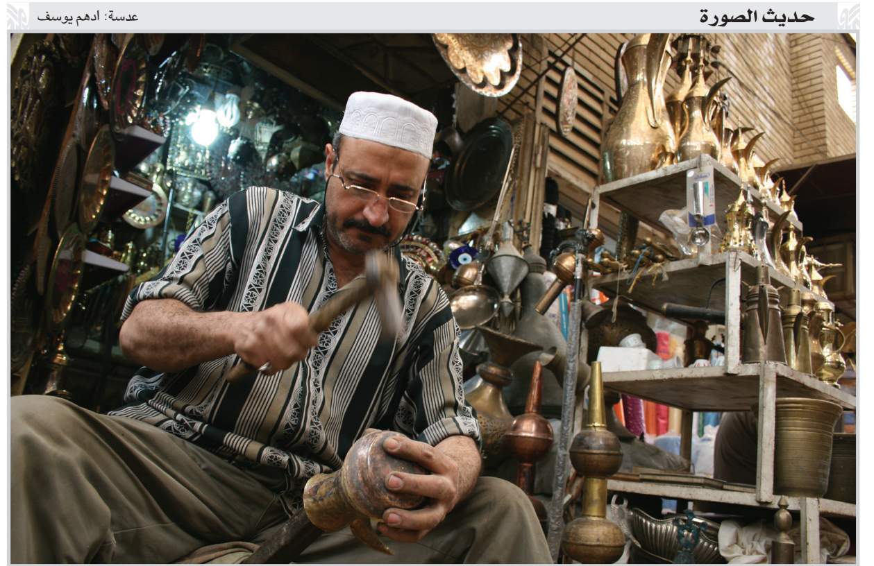
هوية اي شعب من شعوب الأرض تتجسد في عدد مهم من السمات، ولعل الحرف الشعبية واحدة من أهمها وأبرزها، وباتت اليوم تختصر، فمن يستطلع إسعافها؟