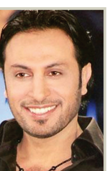
ماجد المهندس: قلبي كبير جدا ويغض النظر عن الإساءة

× آخر إعمالك؟ - إعمالي الغنائية كثيرة لكنني مشغول الآن بتلقي دروس بالفرنسية. × هل أنت متسامح مع من يسبوك؟ - قلبي كبير جدا ويغض النظر عن إساءات الآخرين. × متى بدأت شهرتك الحقيقية؟ - منذ ثلاث سنوات. × هل تحفظ بالملقات التي تكتبك؟ - نعم سواء في الصحف العراقية او العربية. × هوياتك غير الغناء؟ - الرسم والخياطة. × خبر فركك؟ - الاستقرار والأمان بلدي العراق. × أسوأ خبر سمعته؟ - وفاة والدي في العراق ولم استطع حضور جنازته. × مطرب تستمع إليه؟ - كليرون من المطربين استمع إليهم ولكني أتابع الأغنية العراقية. × هل تضع شريطاً غنائياً في سيارتك؟ - سيارتي مليئة بأشرطة أصدقائي المطربين. × ما رأيك بالأغنية العراقية؟ - متميزة دوماً. × هل تقرأ؟ - أحياناً في أوقات فراغ لكنني مدمس على قراءة الشعر. × لآخر شيء فعلته قبل الاتصال بك؟ - كنت أتمرن مع الفرقة الموسيقية.