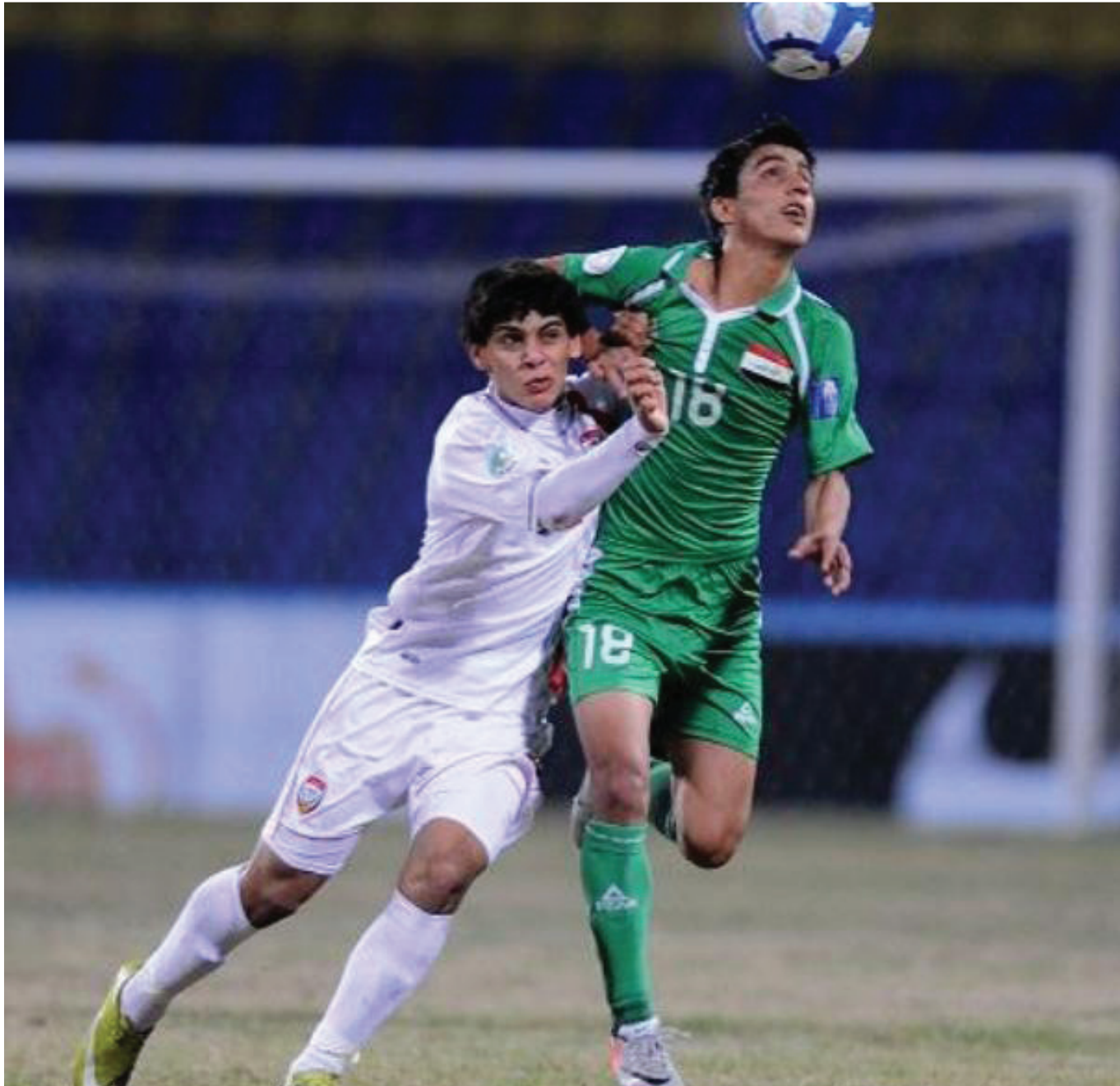
جانب من لقاء منتخبنا مع الامارات

وأكد الحسيني ان تأهل منتخبنا الى هذا الدور بعد احتلاله المركز الأول في مجموعته يمنح لاعبينا دافعا معنويا قويا خصوصا بعد معرفتهم ان منتخب اليابان تأهل الى هذا الدور بعد احتلاله المركز الثاني أي انهم سيضعون في حساباتهم ان هذا الفريق لم يكن أفضل حالا منهم ما يعزز معنوياتهم وأدائهم لذلك أرى ان جميع المؤشرات تصب في مصلحة منتخبنا اليوم للانتقال الى الدور نصف النهائي .