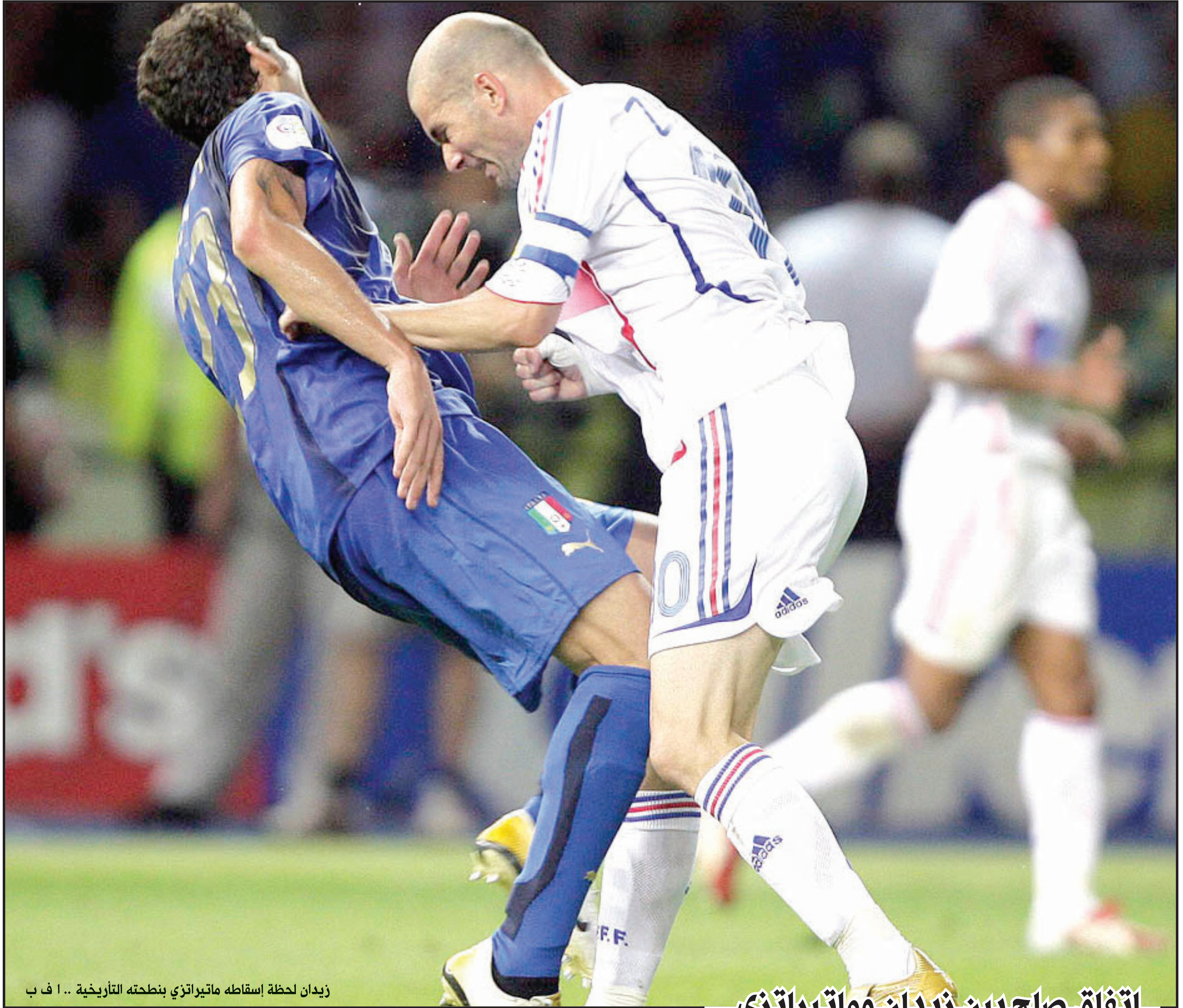
زيدان لحظة إسقاطه ماتيراتزي بنطحته التاريخية

والدكتور حافظ المدلج ورئيس الاتحاد السوري لكرة القدم فاروق سرية لحضور تلك المباراة التي ستجري على ملعب جابر الدولي أول مرة وتوزيع الجوائز على كلا الفريقين وبعدها سيغادر الى العاصمة الأوزبكية طشقند من أجل حضور نهائي بطولة آسيا للناشئين تحت ١٦ عاما التي ستقام يوم غد الأحد بين منتخبَي كوريا الشمالية وأوزبكستان على ملعب باختكور في اختتام منافسات البطولة .