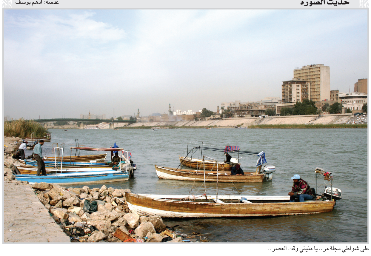
على شواطئ دجلة من... يا منيتي وقت العصر...