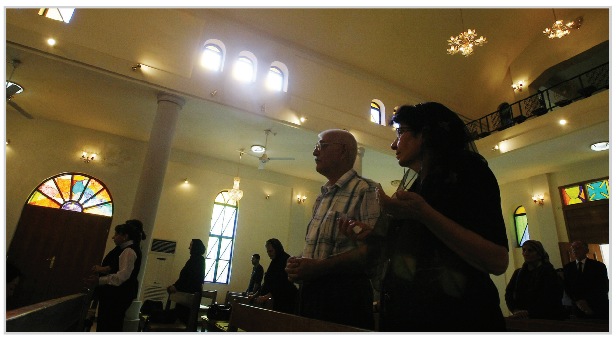
في أول قداس بعد جريمة "سيدة النجاة"، المسيحيون يعودون الى ممارسة طقوسهم أمس