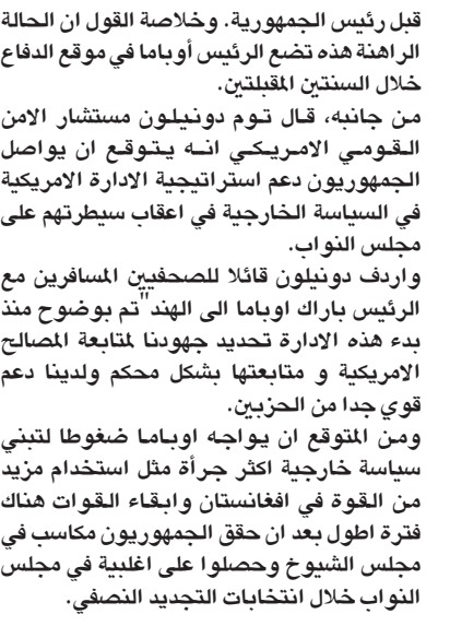
البراهنة هذه تضع الرئيس أوباما في موقع الدفاع خلال السنيتين المقبلتين.

قبل رئيس الجمهورية. وخالصة القول ان الحالة الراهنة هذه تضع الرئيس أوباما في موقع الدفاع خلال السنيتين المقبلتين. من جانبه، قال توم دونيلون مستشار الامن القومي الامريكي انه يتوقع ان يواصل الجمهوريون دعم استراتيجيية الادارة الامريكية في السياسة الخارجية في اعقاب سيطرتهم على مجلس النواب. واربد دونيلون قائلا للصحفيين المسافرين مع الرئيس باراك اوباما الى الهند تم بوضوح منذ بدء هذه الادارة تحديد جهودنا لتابعة المصالح الامريكية و متابعتها بشكل محكم ولدنيا دعم قوي جدا من الحزبين. ومن المتوقع ان يواجه اوباما ضغوطا لتبني سياسة خارجية اكثر جسرا مثل استخدام مزيد من القوة في أفغانستان وبقاء القوات هناك فترة اطول بعد ان حقق الجمهوريون مكاسب في مجلس الشيوخ وحصلوا على اقلية في مجلس النواب خلال انتخابات التجديد النصفية.