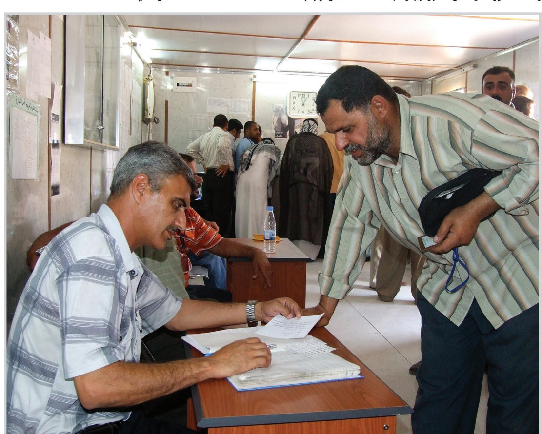
دائرة حكومية...

بابل مفعلة كحكومة الكترونية وخاصة البريد الالكترونى ومخاطباتنا مستمرة مع الدوائر ومركز المعلومات حاليا، سيتم استقبال الشكاوي عن طريق مركز المعلومات في المحافظة وإرساله ألينا عن طريق الرسبائل القصيرة وكل قسم في دائرتنا مفعل لاستقبال الشكاوى وستكون الإجابة عليها عن طريق الاتصال المباشر لصاحب الشكوى أو عن طريق الايميل الخاص به ونحن جادون لتطبيق هذه الخطوة العلمية الصحيحة من اجل خدمة