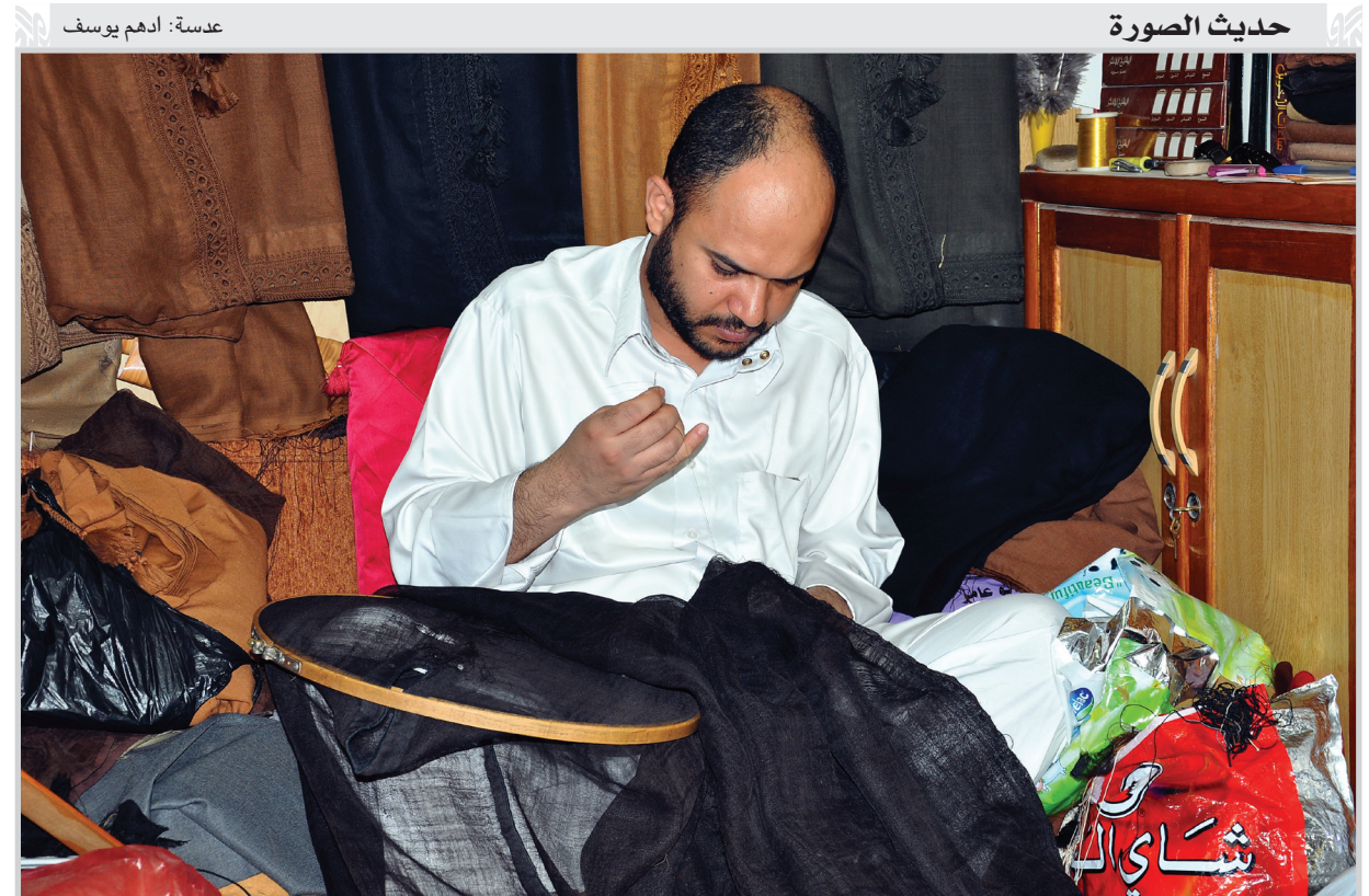
خياطة العباة الرجالية العربية مازالت حرفة نادرة يتوارثها الابناء عن الآباء، ومراكز عملها في الكاظمية والنجف وكربلاء وشارع النهر في بغداد.