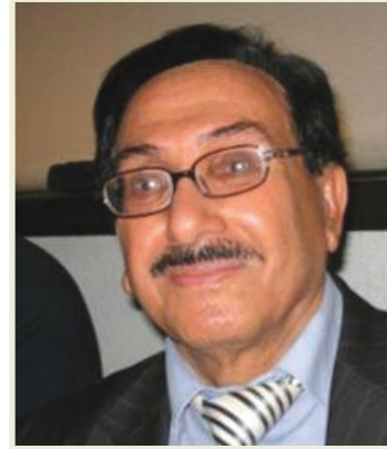
الوزارة طوال الفترة الاخيرة منذ 2003، مشددا على ضرورة اسناد هذه الوزارة الى النخبة الثقافية التي لها القدرة على التواصل مع كافة المؤسسات الحكومية المعنية بالشان الثقافي، مطالبا بتطبيق المعايير التي