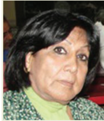
ستستخدم لاختيار وزير الداخلية والدفاع في الشخصية التي ستستلم وزارة الثقافة. اما بشأن العملية الرمزية التي تسعى اليها مجموعة من مثقفي العراق، والتي تنطوي على اجتماع 225 مثقفا في البرلمان لاختيار وزير