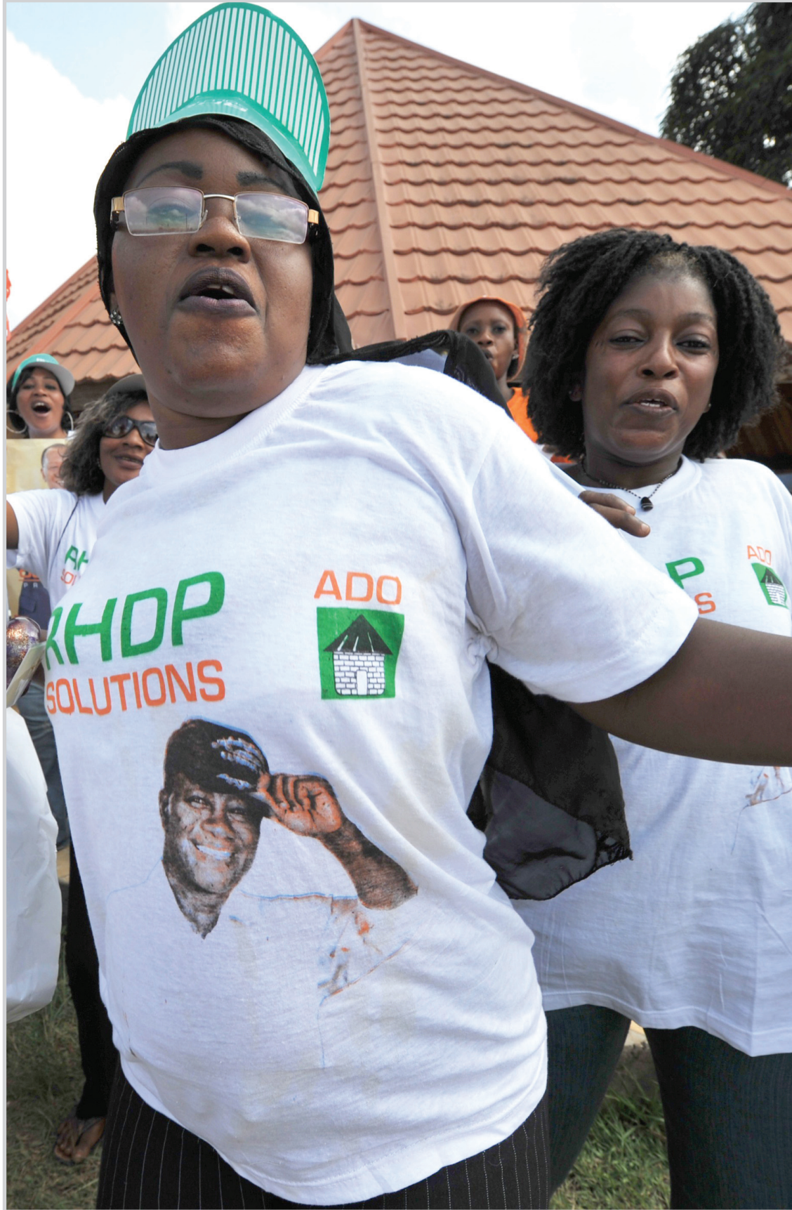
مواطنو ساحل العاج يعولون كثيرا على انتخاباتهم الرئاسية...

اثناء صدامات بين الشرطة ومعارضين كانوا يحتجون على قرار غباغبو فرض حظر التجول ليلا حتى الارباء. وفضا الرئيس الجميع باعلانه حظر التجول مؤكدا انه يريد بذلك ردع بعض المتطرفين"، وفي حين رأى معسكر وتارا في ذلك محاولة "تزوير" دارت نقاشات طويلة السبب بين المرشحين والوسيط رئيس بوركين فاسو بلين كومباري لكنها لم تؤد في الحين الى ايجاد تسوية، وبرعاية كومباري دعا ممثلا الطرفين سويا الى الهدوء والتعهد بالالتزام باحترام نتيجة الاقتراع. وخلال الاسبوع الماضي ساهم الطرفان في اشارة اجواء متوترة بتبادلتهما التهم خلال المهرجانات الانتخابية بالتسبب بكل المحن التي شهدتها البلاد خلال عشر سنوات واتهم كلاهما الاخر بأنه "انقلابي"، وتشهد ساحل العاج اكبر منتج كاكاو في العالم والتي كانت نموذجا للاستقرار في غرب افريقيا، عدم استقرار منذ انقلاب سنة ١٩٩٩ وازمة ٢٠٠٢ وسيواجه الرئيس الجديد مهمة راب الصعد في طرقي ساحل العاج.