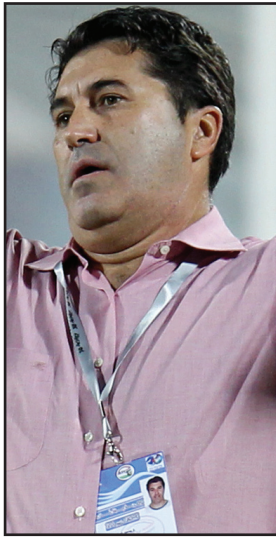
عدن / سبانت

واوضح أن المنتخب القطري دخل المباراة وكانت عينه على الفوز من أجل خطف بطاقة التأهل من العنابي .. مهتماً لاعبي المنتخب السعودي على الأداء الجيد والرائع خلال الشوطين للقوة والعزيمة اللتين يمتلكونها.