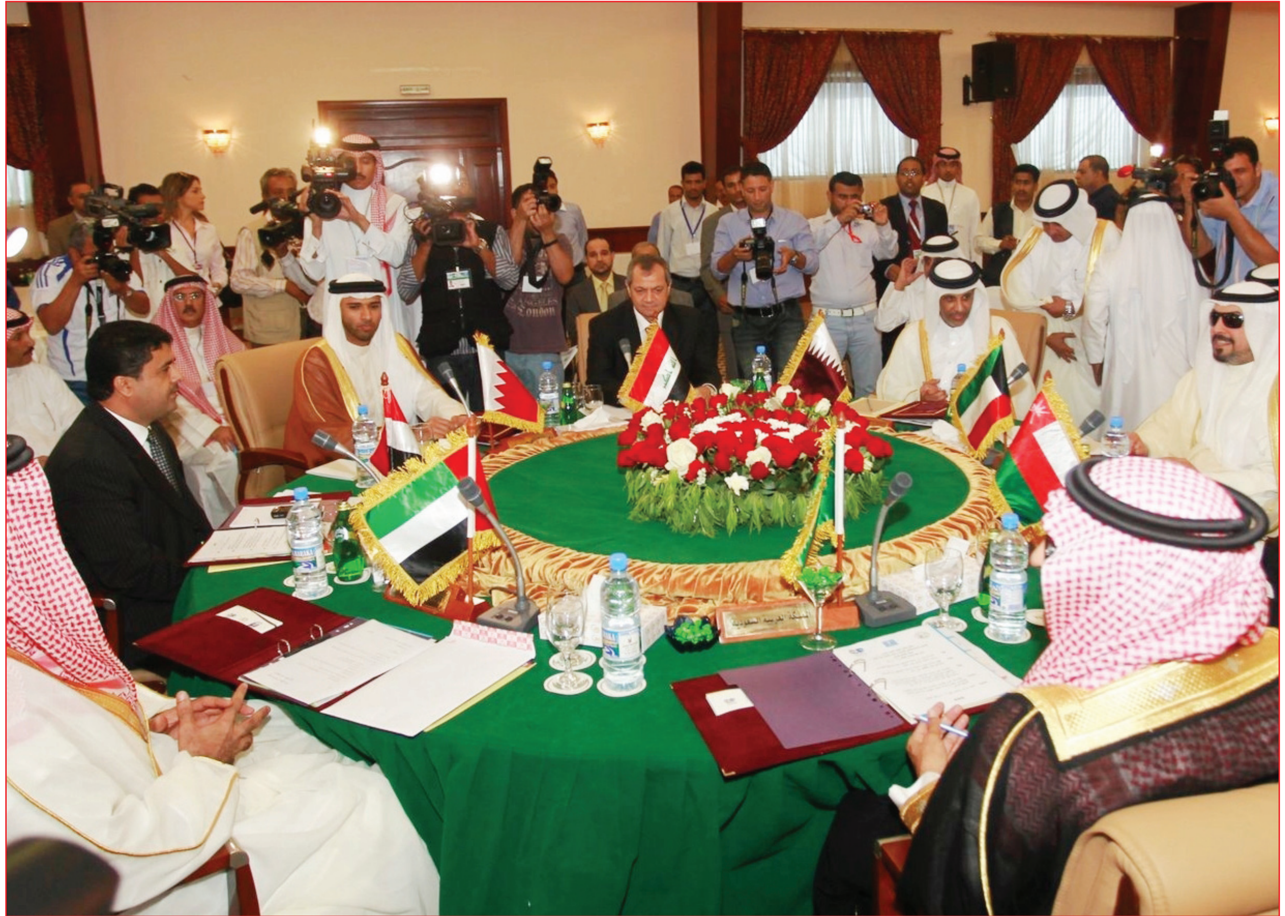
رئيس اتحاد الكرة حسين سعيد أثناء اجتماع رؤساء الاتحادات الخليجية والعراق واليمن أمس السبت

على جزء من واردات تسويق الدورة بدءا من خليجي المنامة، وزيادة عدد الحكام الخليجين المشاركين في إدارة مباريات الدورة، وزيادة المبلغ المخصص لبطل الدورة إلى ٣ ملايين ريال سعودي بدلا من مليونين ووصيفه مليون ونصف بدلا من مليون.