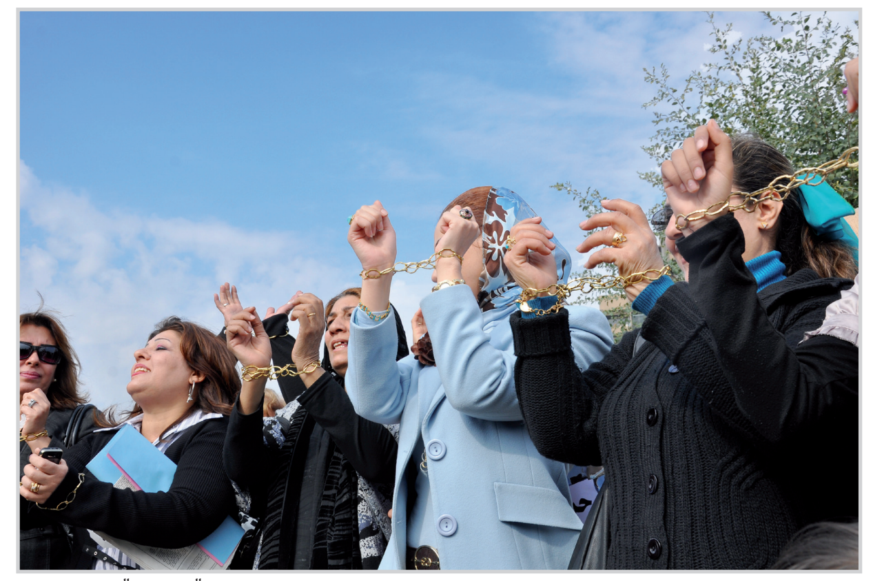
نساء عراقيات اعتصمن في ساحة الفردوس ضمن حملة المدى "الحريات اولا"