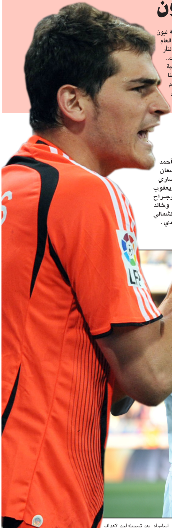
اسامواه بعد تسجيله لحد الاهداف

وينافس جيان أيضاً على لقب أفضل لاعب أفريقي الذي يمنحه الاتحاد القاري للعبة والذي من المنتظر أن يوزع غدا الاثنين في القاهرة.