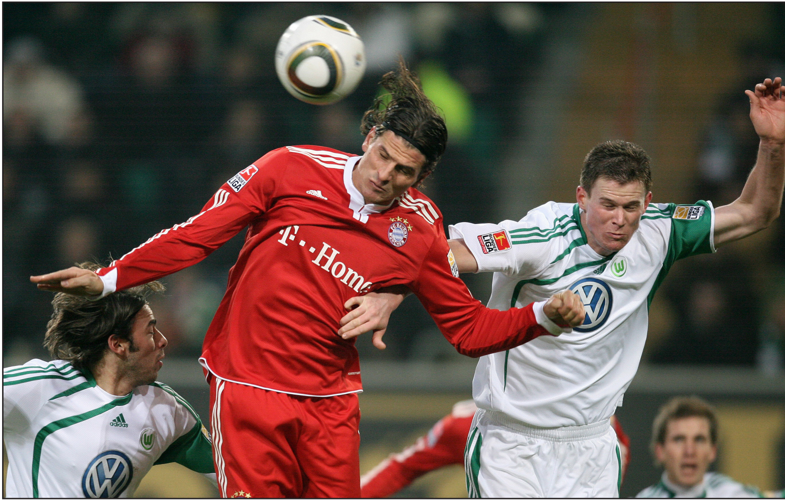
البافاريين في منطف حاسم