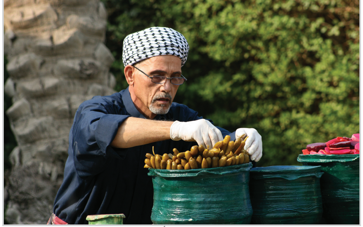
وحدة من الميزات التي تؤكد فرادة المائدة العراقية تتمثل في مذاق الطرشي العراقي خصوصا عندما يكون بانعه عراقي الملاح والمغس.