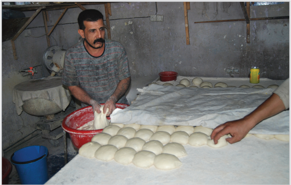
يبقى الخبز العراقي فريدا في طعمه ونكهته خصوصا إذا كان الخبز شابا عراقيا مكافحا من اجل الحصول على لقمة العيش.