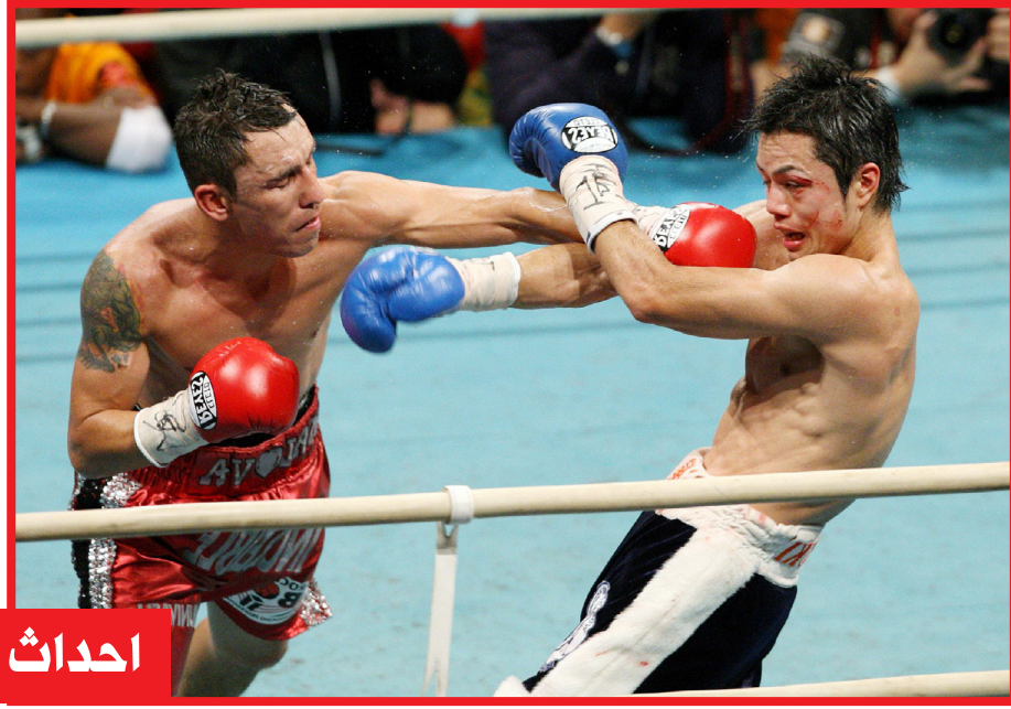
احداث في صور