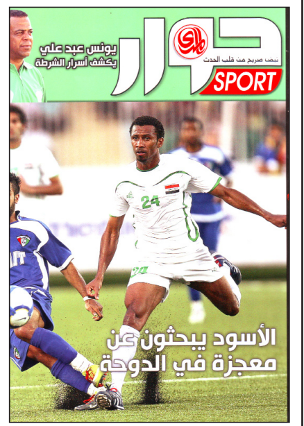
الأسود يبحثون عن معجزة في الدوحة