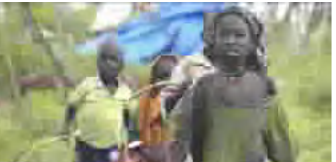
الافريقي الذي يعمل على حل سلمي

الافريقي الذي يعمل على حل سلمي للنزاع الذي اوقع حتى الان ٣٠ الى ٥٠ الف قتيل وادى الى نزوح قرابة ١.٤ مليون شخص عن ديارهم وفق تقديرات الامم المتحدة. واذفاد عبد الوهاب (ما قاله باول اميركيون انهم يحترمون دور وتدخل الاتحاد الافريقي في مسألة (الطلاب) يشار الى ان مفاوضات تجري منذ ٣٣ آب بين حركتي التمرد في دارفور والحكومة السودانية برعاية الاتحاد الافريقي وقد اصطدمت هذه المفاوضات بمسألة الامن ونزع السلاح وعلقت حتى ١٤ ايلول عندما يلتقي الرئيس الحالي للاتحاد الافريقي الرئيس النيجيري اوتوسيفون اوباسانجو اطراف النزاع بناء على طلب من المتمردين وكان المسؤولون رحبوا الخميس بالتوقف اميركي الذي عبر عنه باول فيما اعتبرته الخرطوم جانبيا من الحملة الانتخابية في الولايات المتحدة وخلص وجود الامن الدولي منقسم بشأن مشروع قرار اميركي لفض عقوبات على السودان.