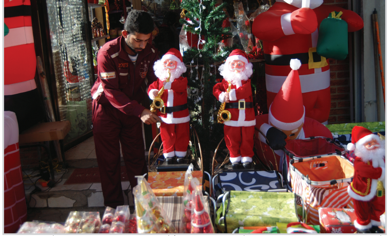
بدأت واجهات المحال في بغداد والمحافظات تزدهي ببناؤيل وأشجار عيد الميلاد الملونة احتفاءً بأعياد الميلاد الجديدة. كل عام والعراق والعراقيون بألف خير.