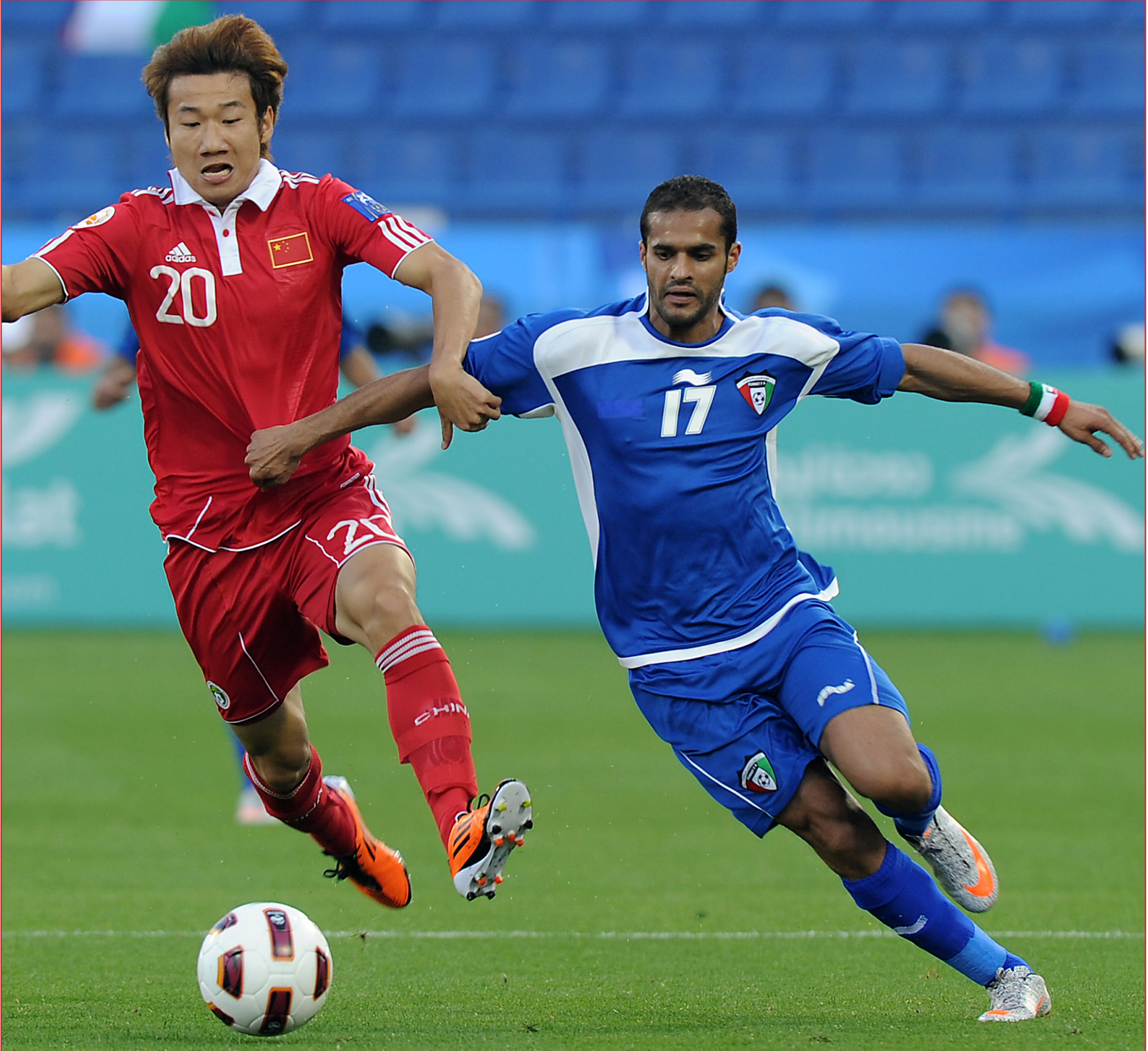
المنتخب الصيني يتغلب على الازرق الكويتي بهدفين دون مقابل

الازبكي كان ان يضيف هدفاً ثالثاً، واطلق الحكم صافرة نهاية المباراة بفوز منتخب اوزبكستان على نظيره القطري بنتيجة (٢-٠ صفراً)، هذه المباراة وضعت المنتخب القطري منظم البطولة بوضع حرج سينعكس سلبي عليه في مباراته المقبلة امام الصين يوم الازيعة المقبل.