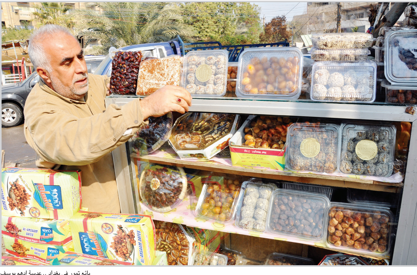
بائع تمرور في بغداد

الى مجلس النواب لكي يتم التصويت على التعديلات المقترحة من قبل مجالس المحافظات. وشهد المؤتمر الذي انعقد تحت شعار (مجالس المحافظات بين الواقع والطموح) اقامة ٣ ورش عمل في محاور المجالس واجراءات تكوينها وصلاحيات رؤساء الوحدات الادارية وموضوع الموارد المالية للمحافظات.