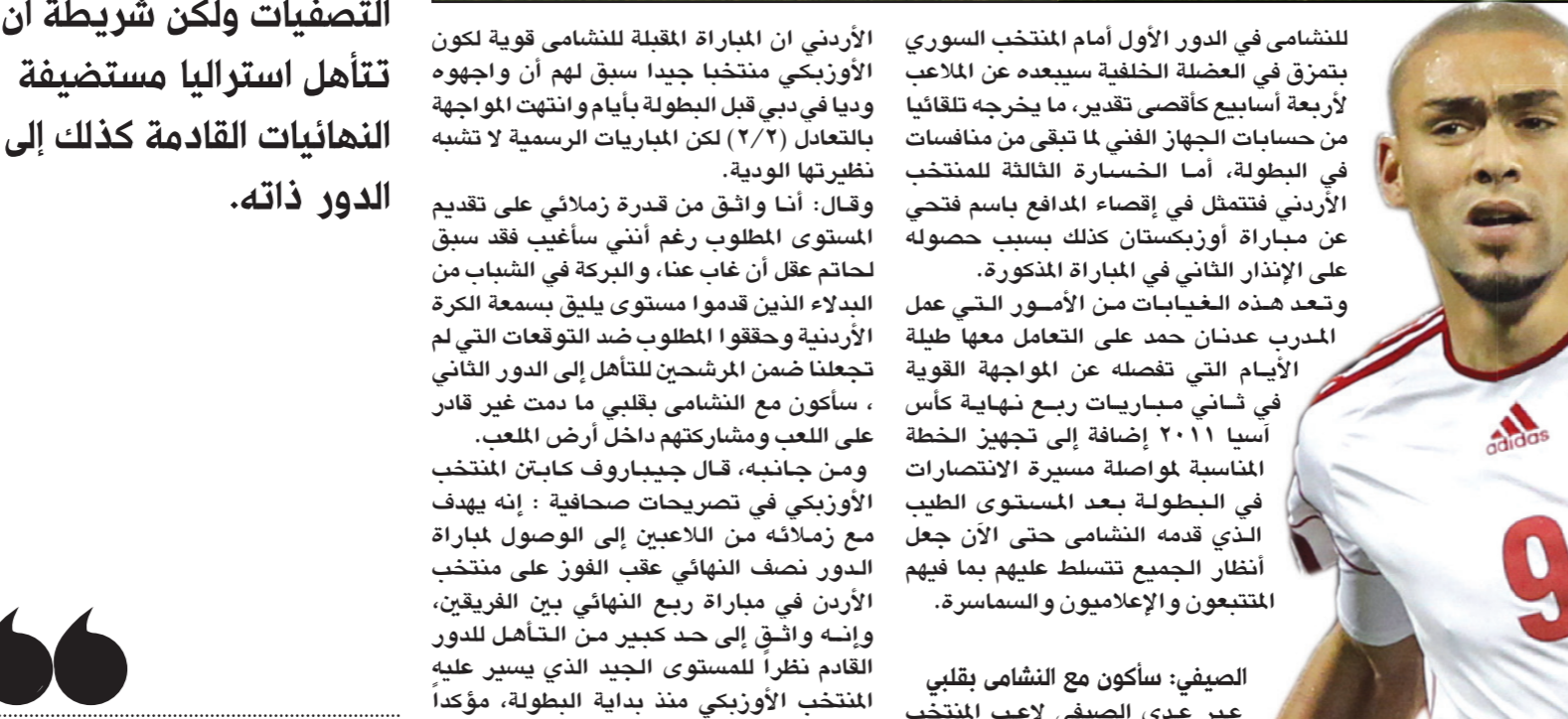
ياسر المحطاني لم يقرر استواره المعبود