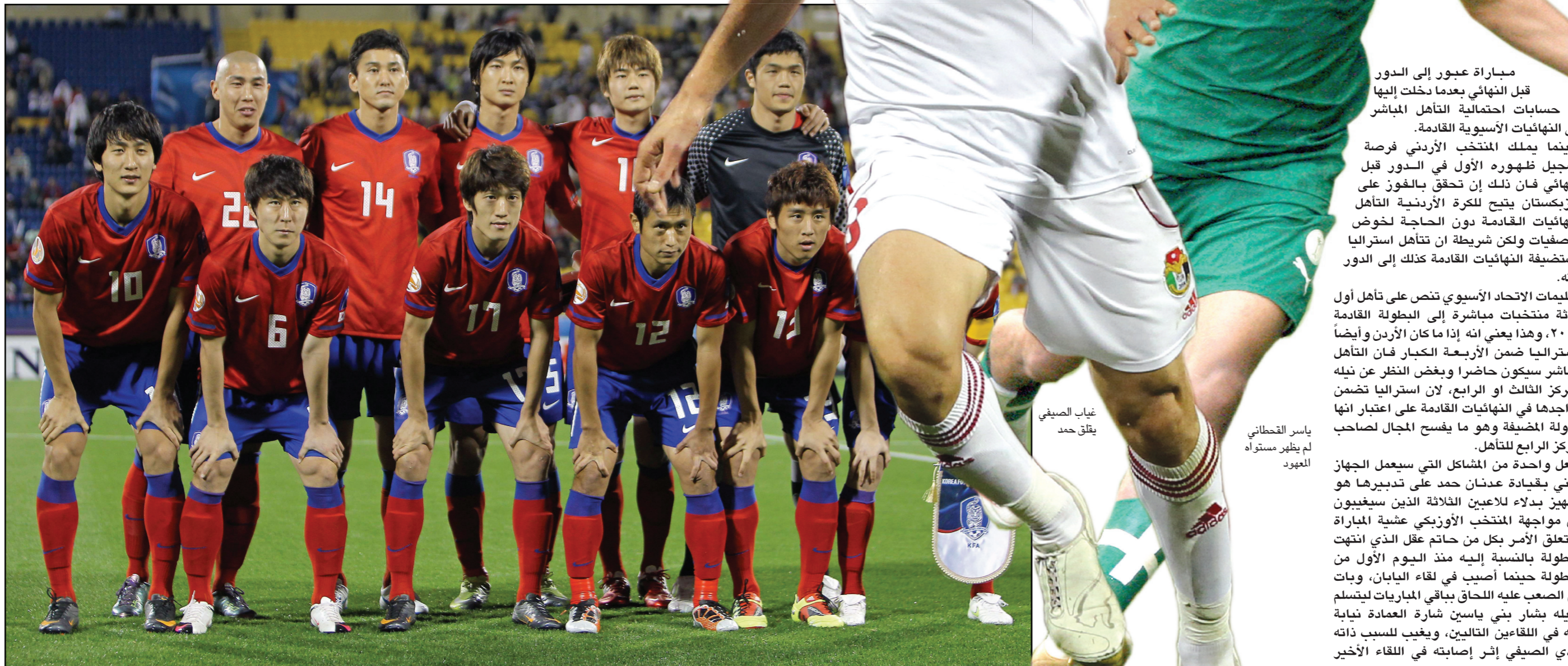
غياب الصبيغى يلقح حمد