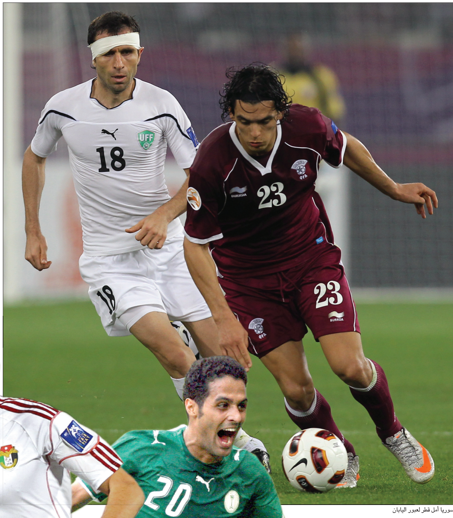
سوريا أمل قطر لعبور اليابان