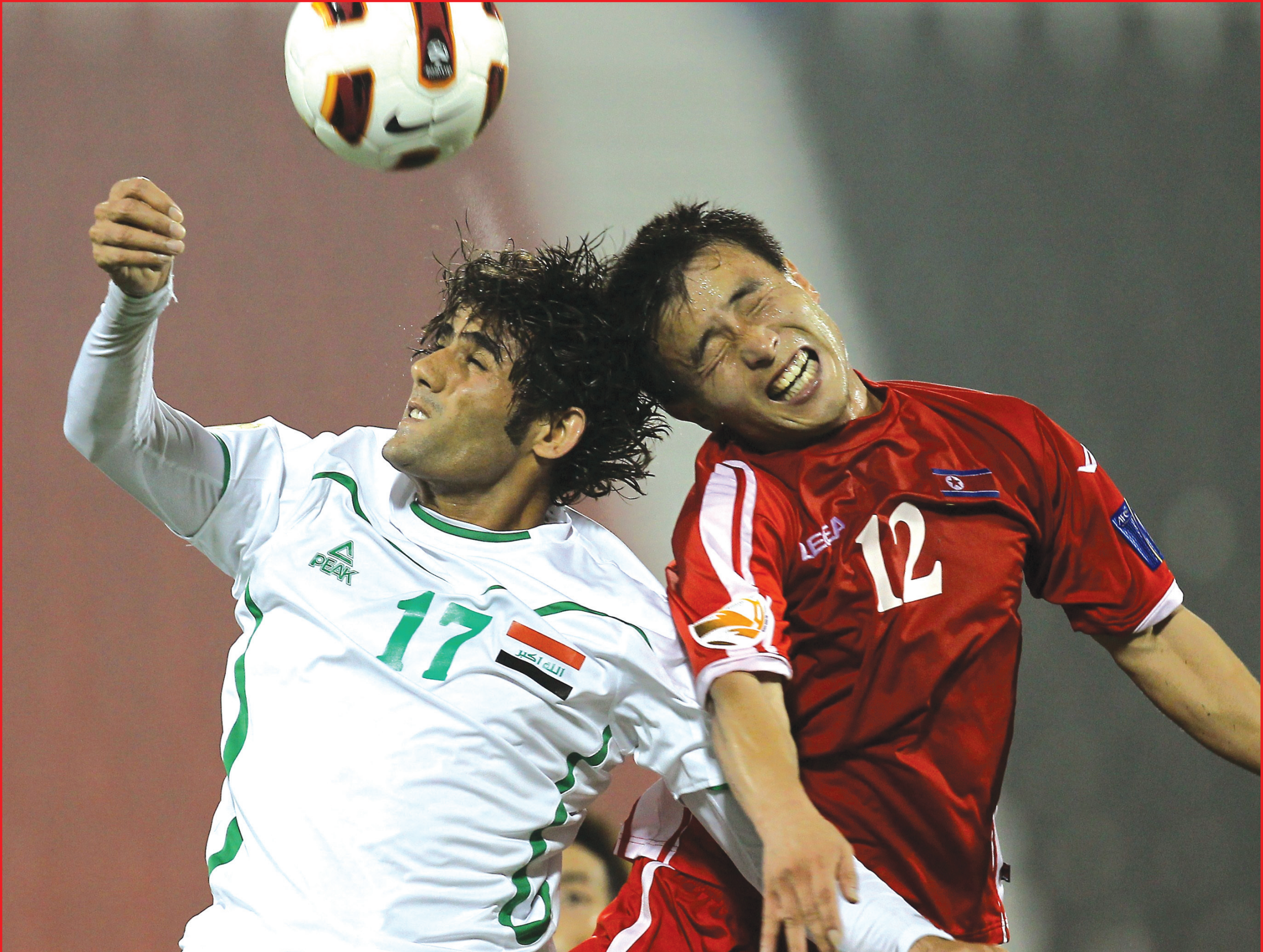
منتخبنا دافع ببسالة عن لقبه وخرج مرفوع الرأس..